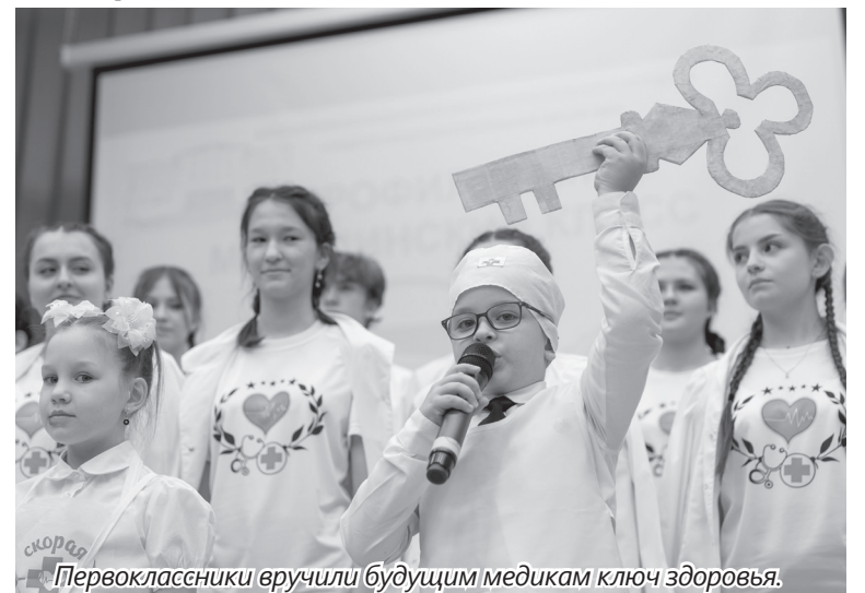
Первоклассники вручили будущим медикам ключ здоровья.

После этого учащиеся произнесли клятву медицинского класса и по традиции исполнили гимн студентов «Гаудеамус» на латинском языке.