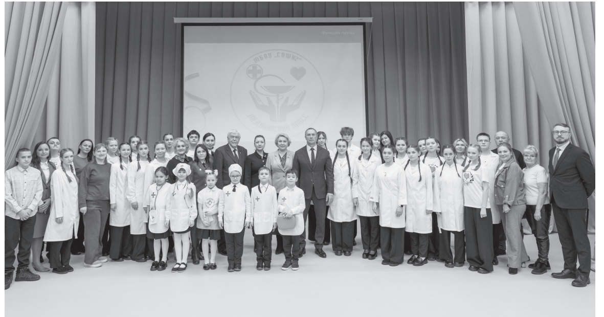
Более двадцати будущих медицинских работников получили свои первые белые халаты.

Профильные медицинские классы существуют в городе с 2015 года. Сегодня в них обучаются 43 старшеклассника. Пятнадцать выпускников вузов уже работают врачами, остальные учатся в медицинских образовательных учреждениях. Всего за это время школа № 2 дала путевку в жизнь 132 учащимся медкласса. Отметим, что создание и расширение сети профильных классов является одной из ключевых задач национального проекта «Молодежь и дети».