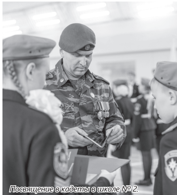
Посвящение в кадеты в школе № 2.

— Я как депутат окружной Думы и ветеран СВО провожу очень много таких встреч. Общаясь с молодежью, сам заряжаюсь энергией. Сегодня ребята вели себя очень активно: интересовались вопросами армейского быта, спрашивали, как преодолеть тяготы службы, побороть страх, замотивиро-