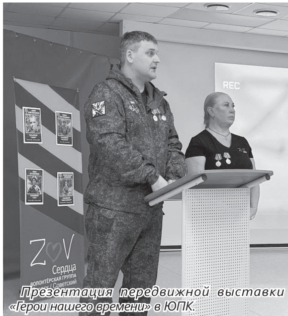
Презентация передвижной выставки «Герои нашего времени» в ЮПК.

Мнение ветерана СВО разделяет и руководитель волонтерской группы «ZOV сердца