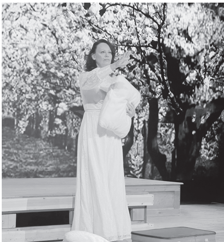
Спектакль «Вишневый сад».