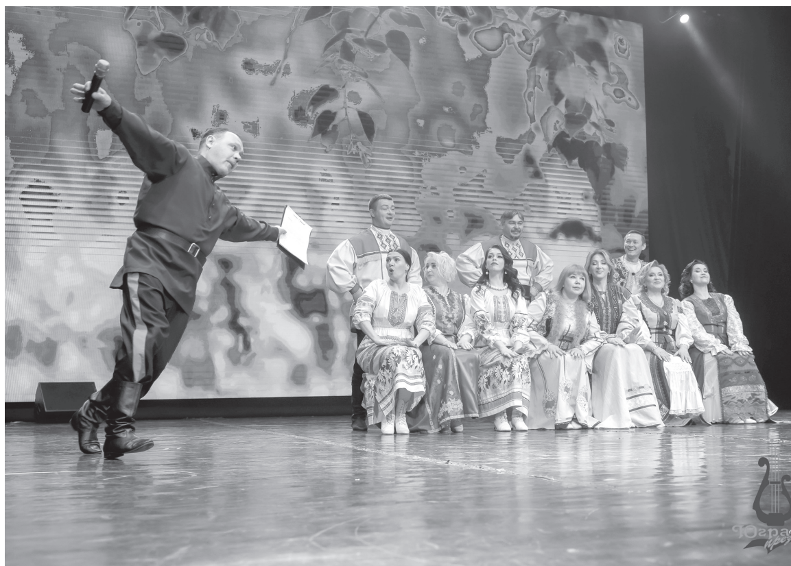
Концерт, посвященный юбилею танцевального коллектива «Вдохновение».

ла подумать над переездом в Югорск. В телекомпании «Норд» мне предложили зарплату в несколько раз выше, и мы поехали, рассчитывая за год-полтора подзаработать денег и решить жилищную проблему. Но через три месяца понял, что больше не могу — я все же не телевизионщик, вести передачи и делать сюжеты не мое. И мы уехали в Геленджик, куда меня пригласили в качестве режиссера в отель «Газпрома». Там мы пробыли больше года и приехали в Югорск в гости к родителям. И тут мне предложили должность режиссера и служебное жилье. Согласился, конечно. Центра культуры «Югра-презент» еще не было, он только строился. Я набрал группу, и мы начали работать.