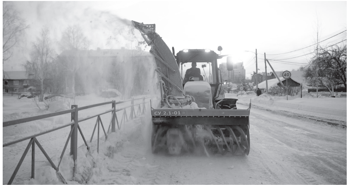
В сильные снегопады техника начинает работать еще ночью.

Всего с начала зимы с улиц Югорска вывезено 112 тысяч кубических метров снежных масс.