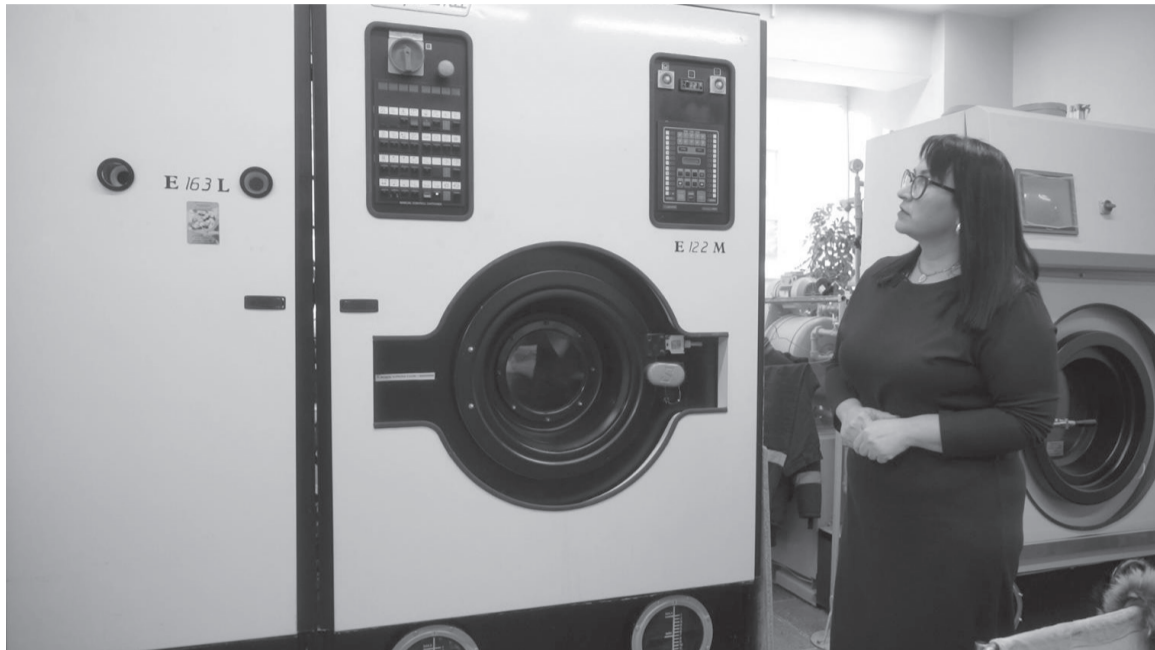
В конце 2024 года благодаря реновации в химчистке появилось современное оборудование.

Для целого ряда вещей обычная стирка, даже в самой современной стиральной машине, не подходит — и в этом случае на выручку жителям Югорска приходит химчистка. О том, как устроен производственный процесс, читайте в нашем материале.