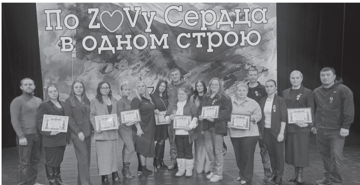
Активисты объединения «ZOV Сердца Югорск/Советский/Севастополь/Россия» получили заслуженные награды.

— Низкий поклон и слова безмерной благодарности нашим солдатам за то, что остановили врага на подступах к мирным городам и поселкам. Севастополь периодически обстреливают, поэтому мы живем в режиме реального времени, а вот жителям Югорска и других городов может показаться, что войны как бы нет,