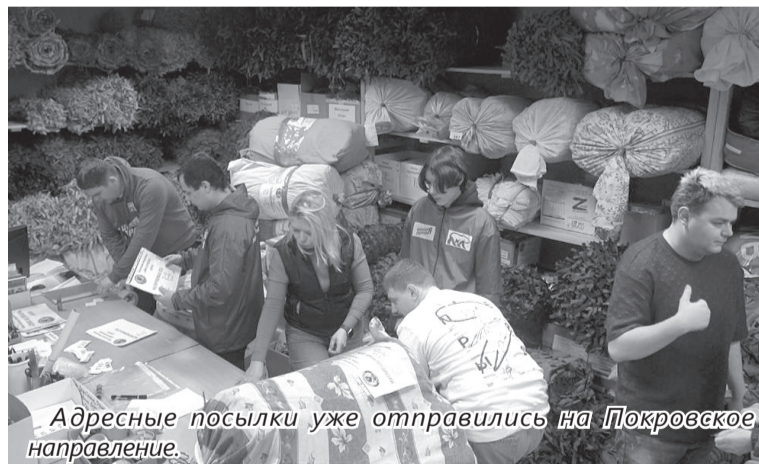
Адресные посылки уже отправились на Покровское направление.

— Мы совместно со Свердловской областью делаем большую отправку на Покровское направление. Наше объединение подготовило более десяти кубометров груза. Что туда входит? Сейчас, пока еще лежит снег, бойцам очень нужны зимние маскировочные сети. Сети на капроновой основе больше годятся для отрядов БПЛА, ими они закрывают технику. Пластиковые сети незаменимы для укрытия