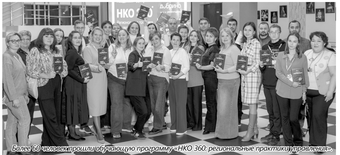
Более 60 человек прошли обучающую программу «НКО 360: региональные практики управления».

— Чем вы можете объяснить такой всплеск?