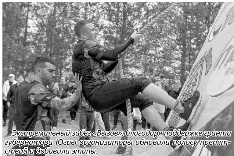
Экстремальный забег «Вызов»: благодаря поддержке гранта губернатора Югры организаторы обновили полосу препятствий и добавили этапы.

— Если в процессе реализации гранта возникают форс-мажорные обстоятельства, допустим, авторы проекта понимают, что не укладываются в смету, что делать?