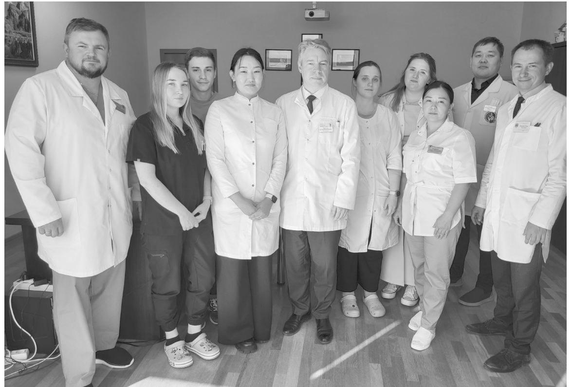
Штат Югорской городской больницы пополнился новыми специалистами.

Ключевые достижения 2025 года были связаны с реализацией национальных проектов, развитием телемедицинских технологий и внедрением современных протоколов реабилитации.