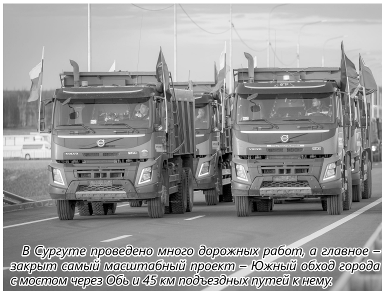
В Сургуте проведено много дорожных работ, а главное — закрыт самый масштабный проект — Южный обход города с мостом через Обь и 45 км подъездных путей к нему.