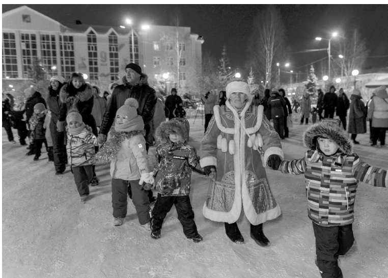
Новый год — праздник, наполненный ожиданием волшебства.

— Отличный праздник, шикарная елка! Великолепные