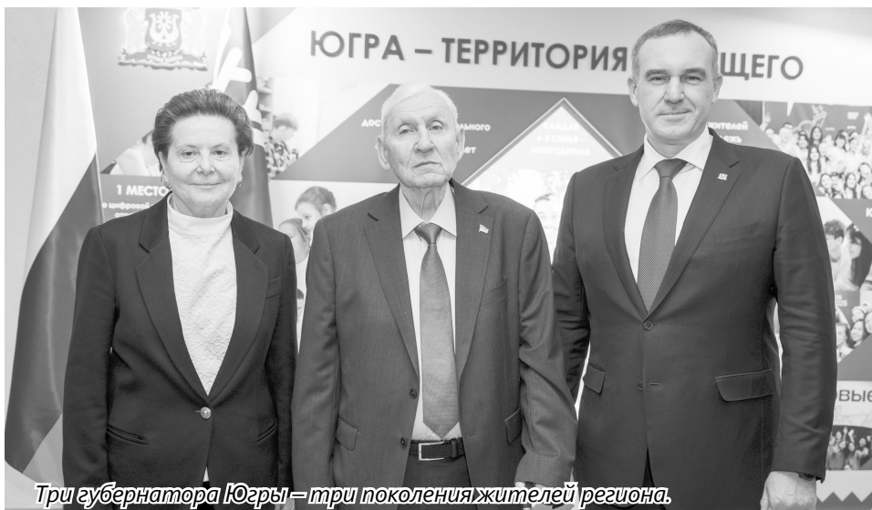
Три губернатора Югры — три поколения жителей региона.

Одну из высших государственных наград России — орден «За заслуги перед Отечеством» I степени, которого удостоиваются люди за трудовые успехи и многолетнюю добросовестную работу, получила уполномоченный по правам