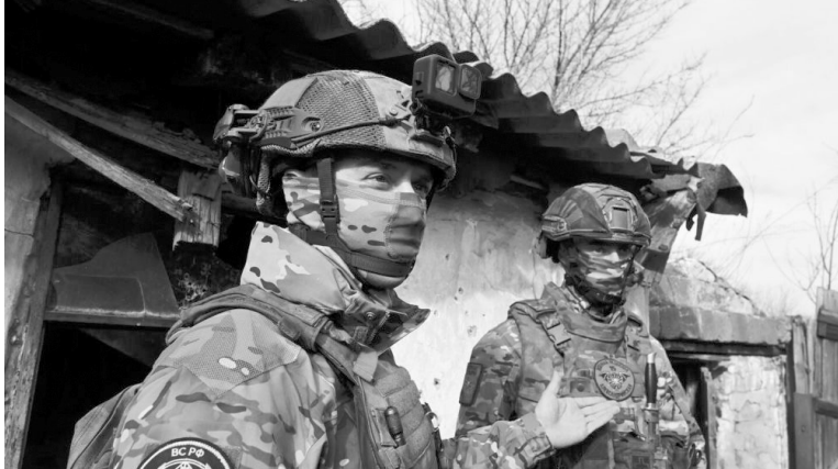
Весь расчет БПЛА и командир подразделения получили 10 миллионов рублей.

От фпв-дронов, РСЗО, автомобилей до натовской бронированной техники и самолетов — за воинскую доблесть в уничтожении вражеской техники в зоне специальной военной операции положены не только боевые награды, но и достойные деньги: от 50 тысяч до нескольких миллионов рублей.