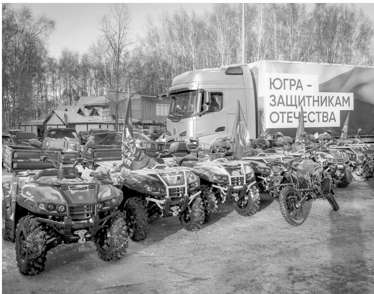
По заявкам военнослужащих и воинских частей на передовую передали 8,8 тысячи единиц высокотехнологичной электроники: 8829 БПЛА и ФПВ-дронов, 436 единиц транспорта.

Из Ханты-Мансийского автономного округа в зону специальной военной операции с начала 2025 года направлено почти 13,5 тысяч единиц техники и оборудования.