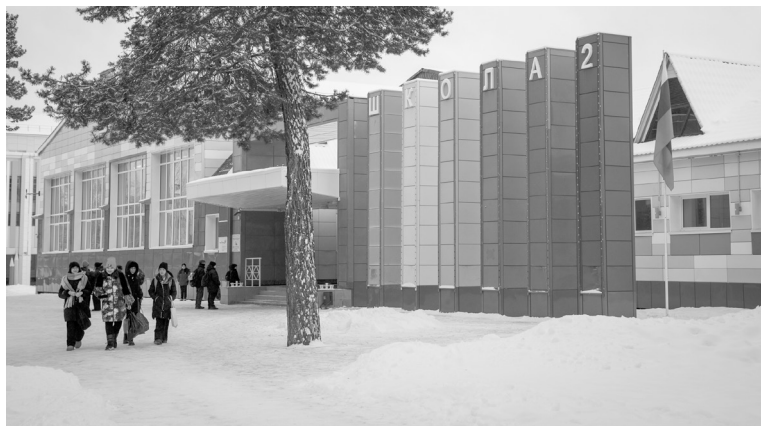
В ближайшие три года в округе предусмотрено строительство и проектирование 21 школы.

В этом году резонансной в автономном округе стала