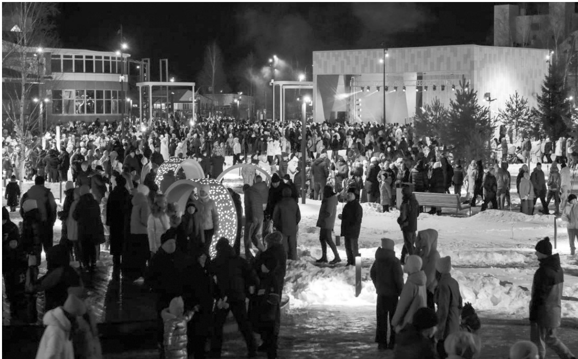
Сотни жителей и гостей города пришли на торжественное открытие сквера.