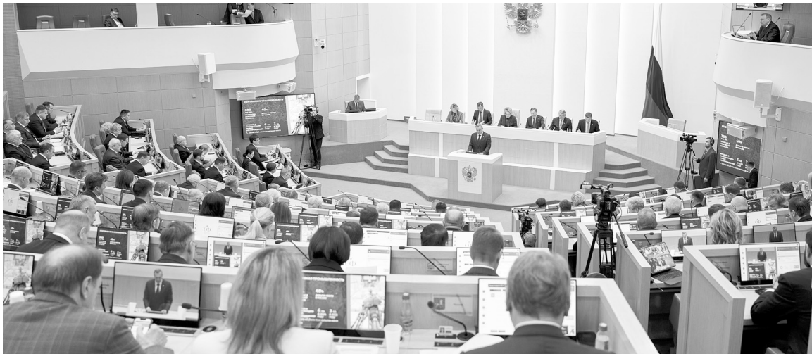
Югру назвали опорой России и отметили социальную поддержку в регионе.

Завершились Дни Югры в верхней палате парламента пленарным заседанием, где все сенаторы познакомились с достижениями Югры и поддержали ключевые инициативы региона.