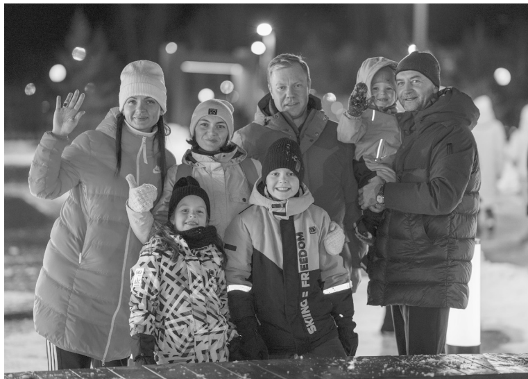
На открытии сквера было много семей с детьми.

К середине нулевых годов городской парк, ставший к тому времени местной достопримечательностью, оброс архитектурными артефактами. На его территории появился так называемый «Камень трех дорог», скульптура орла, прилетающего напиться из искусственного водоема, и другие примечательные объекты. Смелым и оригинальным решением в то время была установка в парке уменьшенной копии Эйфелевой башни с часами, которая сразу же превратилась в популярный арт-объект для фотосессий. Такой необычный