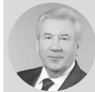
Борис ХОХРЯКОВ, председатель думы Югры

Дни Югры в Совете Федерации дали нам возможность широко и предметно обсудить вопросы, которые сегодня связаны с развитием нашего региона. Это проекты, связанные с реализацией социальных программ по проектированию строительства новых объектов социальной, дорожной и транспортной инфраструктуры и жилищно-коммунального комплекса. Отдельное направление, которое поддержали сенаторы, — наши инициативы по донстройке федерального законодательства, которое ориентировано на поддержку нефтяной отрасли.