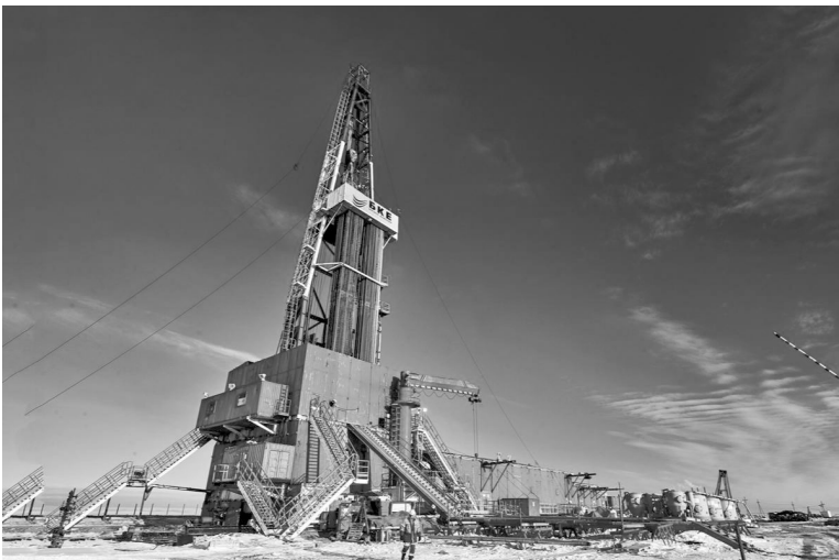
Налоговые льготы для нефтяников сохранят стабильность в Югре и России.

Дни Югры в Совете Федерации стали важным событием, подчеркивающим значимость региона для всей страны. На площадке обсудили вопросы развития региона и реализацию крупных проектов в экономике, промышленности, культуре и социальной сфере. Федеральные власти готовы поддержать Югру в развитии инфраструктуры и повышении качества жизни северян.