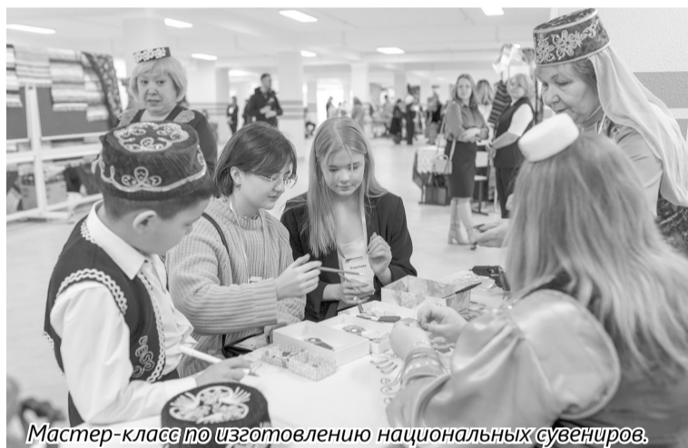
Мастер-класс по изготовлению национальных сувениров.

— Ассамблея народов России объединяет под своим крылом все народы нашей огромной страны в одну большую семью. Ее представительства есть во всех субъектах Российской