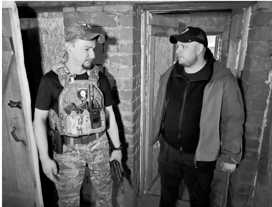
Сам Виталий героем себя не считает. Скромно говорит про полученные награды и медали. Да и в отпуске, признается, был всего лишь раз.

«Мужики там воюют как следует» — эти слова верховного главнокомандующего стали высочайшей оценкой действий добровольческой бригады «Ветераны» после освобождения Авдеевки. Именно там российские бойцы впервые отработали тактику внезапного прорыва в тыл врага с использованием коммунальной инфраструктуры — проще говоря, канализационных труб.