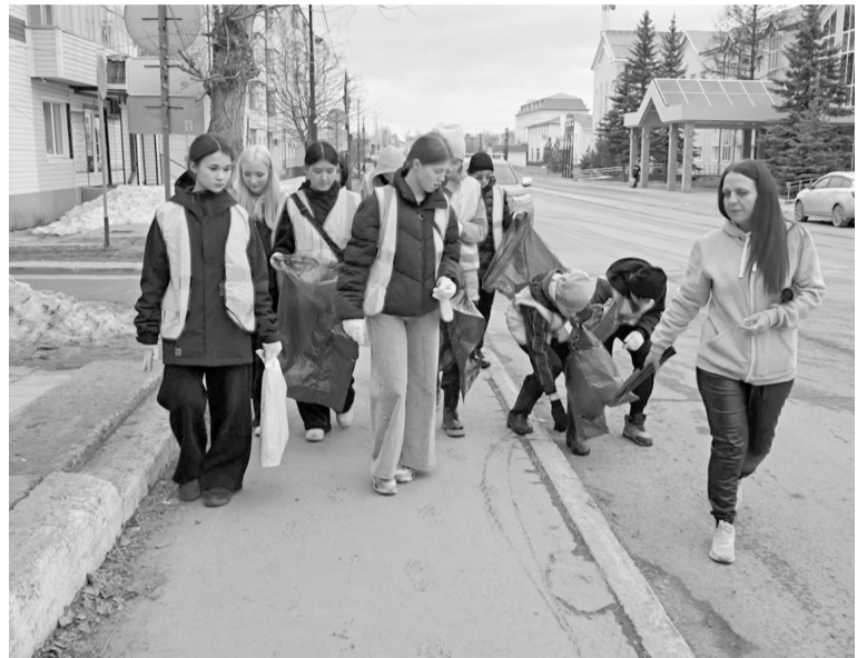
Ребята из молодежных отрядов помогают в наведении порядка на улицах нашего города.

«У нас есть возможность направить их в городские учреждения в качестве помощников делопроизводителей, бухгалтеров или они могут поработать с картотекой книжного