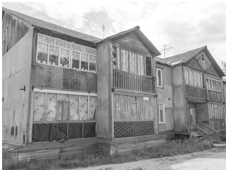
Ветхие дома на улице Мира.

Всего за три года планируется направить на переселе-