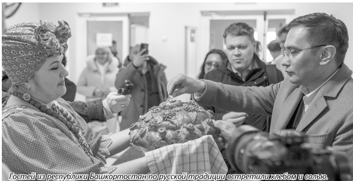
Гостей из республики Башкортостан по русской традиции встретили хлебом и солью.

— Где бы мы ни были в России, везде есть наши земляки. Это очень приятно. По данным последней переписи населения, в Ханты-Мансийском автономном округе проживают более тридцати тысяч башкир, которые чувствуют себя в Югре очень хорошо, находятся в мире и согласии с другими народами. Именно об этом мы и будем говорить на форуме, искать точки соприкосновения, которые объединяют многонациональную Россию в единый народ. Страна у нас огромная, она будет жить, развиваться и процветать до тех пор, пока мы, все такие разные, ее любим, — своим мнением о важности