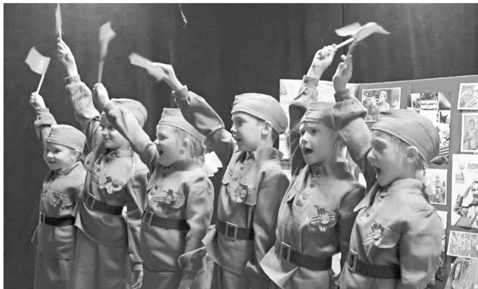
Постановка «Как музыка Победу приближала» театрального кружка «Занавес» детского сада «Снегурочка».