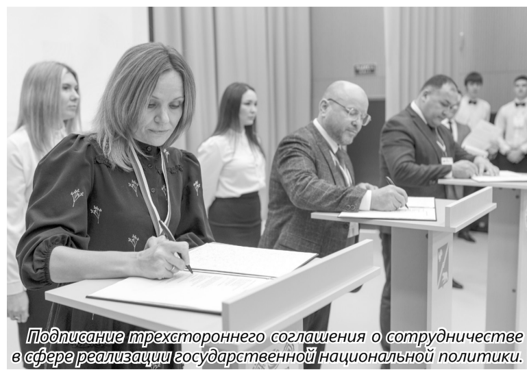
Подписание трехстороннего соглашения о сотрудничестве в сфере реализации государственной национальной политики.