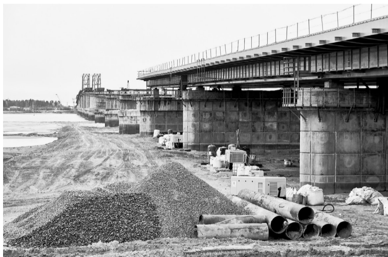
Новый мост через Обь у Сургуты станет главным связующим звеном транспортных направлений Арктика — Азия и Северный широтный ход.

цу Ханты-Мансийского автономного округа. Это позволит нам реализовать многолетнюю мечту жителей Кондинского района и Урая, — сказал глава региона.