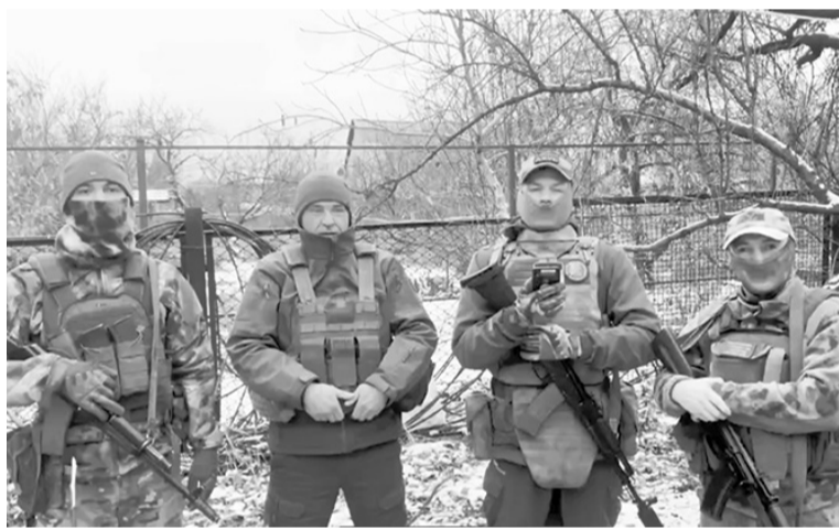
Бойцы поблагодарили губернатора за поддержку и обратились с просьбой.

Тем не менее, бойцы и ветераны СВО нуждаются в поддержке общества, властей. По-