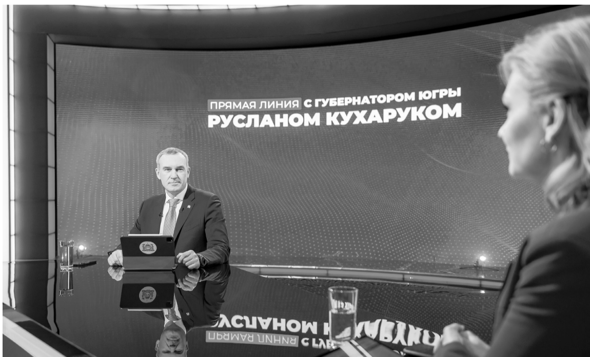
Прямая линия продлилась 2 часа 55 минут.

Напомним, что по результатам рабочих поездок по муниципалитетам и встреч с жителями по поручению Руслана Кухарука был сформирован Комплексный план дорожной деятельности по трассам