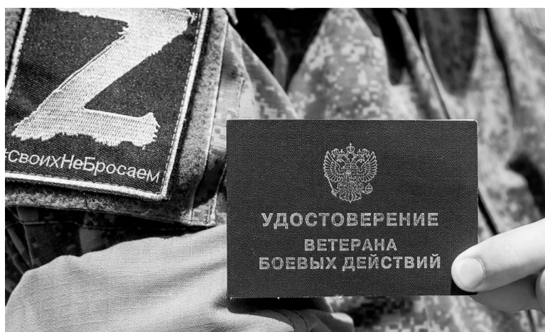
Поддержка участников СВО – приоритет в работе окружного правительства