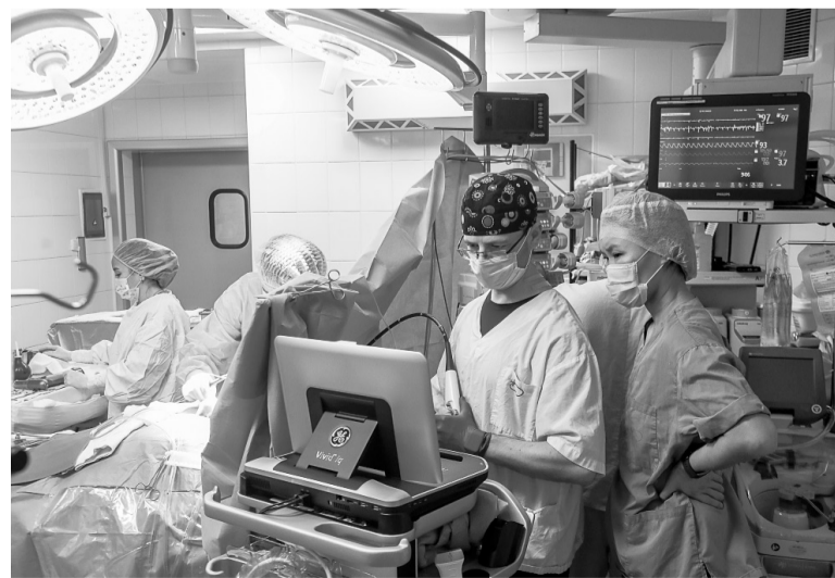
В автономном округе развивается высокотехнологичная медицина.

Кроме того, югорчан волновал вопрос обеспеченности медицинскими кадрами. Руслан Кухарук отметил, что этот вопрос в учреждениях здравоохранения возникал в каждом из 22 муниципалитетов региона во время его летних рабочих поездок. — Недостаточно лишь одним уровнем заработной платы создать условия для того, чтобы человек приехал трудиться, создал семью и был привязан к этому месту работы. Привлечение кадров — всегда комплексный подход, и эту задачу мы транслировали департаменту здравоохранения Югры, — подчеркнул губернатор.