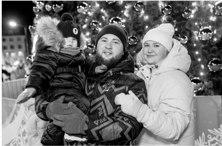
Новый год — любимый семейный праздник.

Открыли елку и в микрорайоне Югорск-2. Дед Мороз, Снегурочка и другие сказочные персонажи устроили настоящий карнавальную марафон, предложив всем принять участие в конкурсах и играх. Конечно, и здесь тоже завершением праздника стал хоровод вокруг сияющей новогодней красавицы.