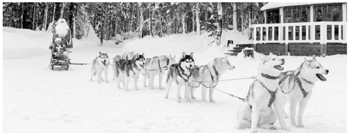
Хотите отправиться в новогоднее путешествие на Морозобусе в сказочный лес «Эссландия»?

найдет для себя то, что ему интересно. С 10 по 28 декабря на новогодних мастер-классах в творческой мастерской «Снежный АРТ» можно своими руками сделать уникальный подарок для друзей и родных. Что это будет — гномик на елку или новогодняя свеча — выбирать вам. Записаться на мероприятие можно по тел. 7-66-93.