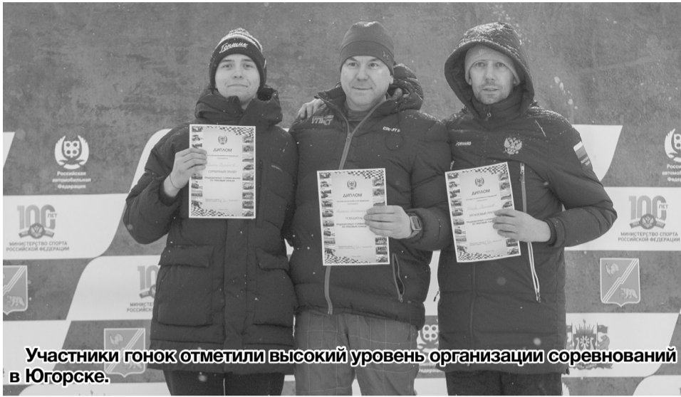
Участники гонок отметили высокий уровень организации соревнований в Югорске.

14 и 15 декабря в Югорске по инициативе Федерации автомобильного спорта России прошел первый этап чемпионата страны по трековым гонкам на легковых автомобилях в классе «Лада». Местом масштабных соревнований была выбрана специально переоборудованная лыжная трасса КСК «Норд».