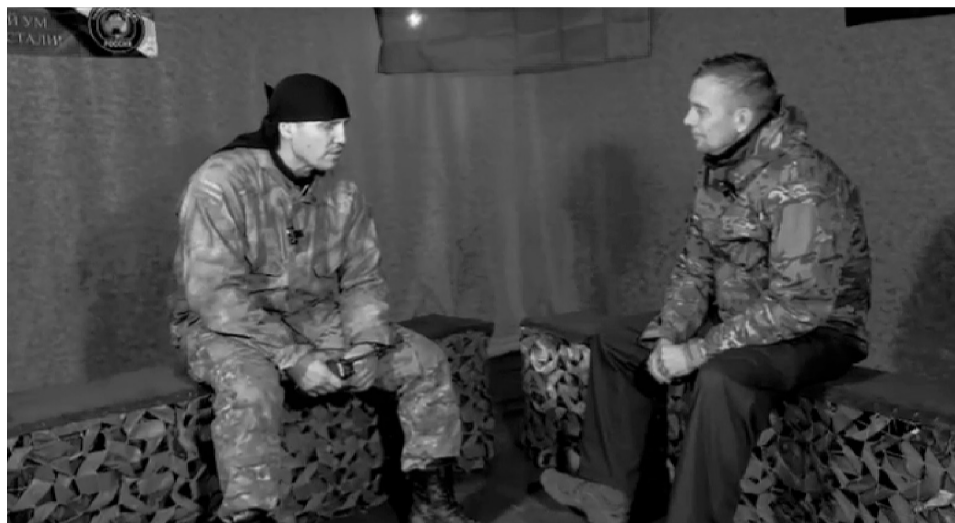
Он родился в советское время, воспитан трудовым народом, поэтому, не задумываясь, отправился на защиту Родины.

В начале 2015 года вооруженные силы ДНР и ЛНР разгромили части ВСУ, зажатые в кольцо в районе города Дебальцево, полностью захватив плац-