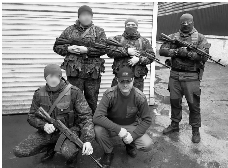
Донецк. Инструкторская работа с ополченцами. 2020 год.