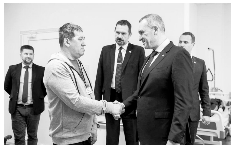
В Югорском КЦСОН разработаны программы реабилитации взрослых с ограничениями по здоровью, что позволяет развить двигательные навыки.

вать те подходы, которые сегодня действуют на территории округа. В 2025 году в Ханты-Мансийске планируем провести кубок защитников Отечества по зимним видам спорта для героев СВО — это будут соревнования по следж-хоккею, горным лыжам, лыжным гонкам и сноуборду, —