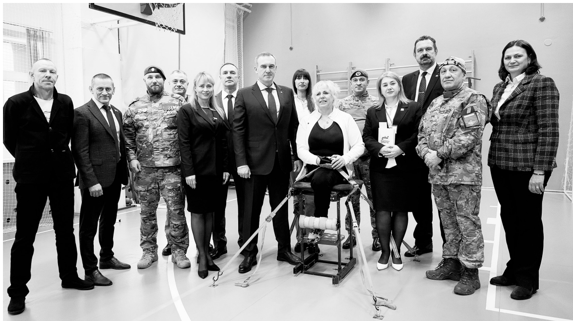
Центр адаптивного спорта в Югорске готов работать с ветеранами СВО — это позволит нашим бойцам вернуться к максимально активной жизни.

главная тема Югорск посетил губернатор Югры