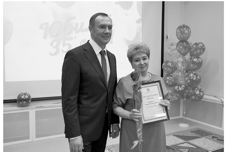
Педагоги детского сада «Снегурочка» получили заслуженные награды.

В детском саду трудятся 115 сотрудников, педагоги являются победителями муниципальных и региональных