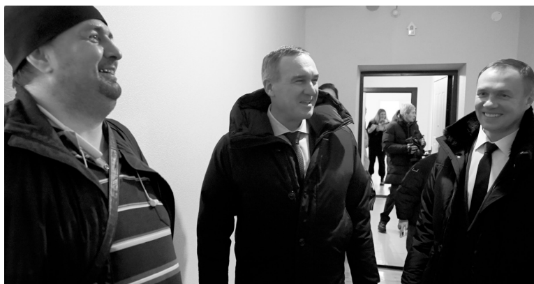
Первыми новоселами дома на ул. Магистральной, 21 станут семьи, которые переедут сюда на условиях соцнайма из аварийного жилья.