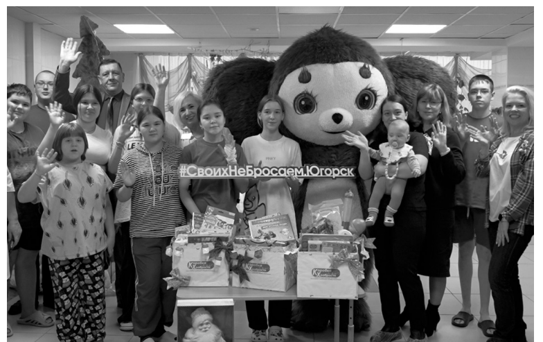
Хорошее настроение — залог быстрого выздоровления.

Поддержать юных пациентов пришли и волонтеры со-