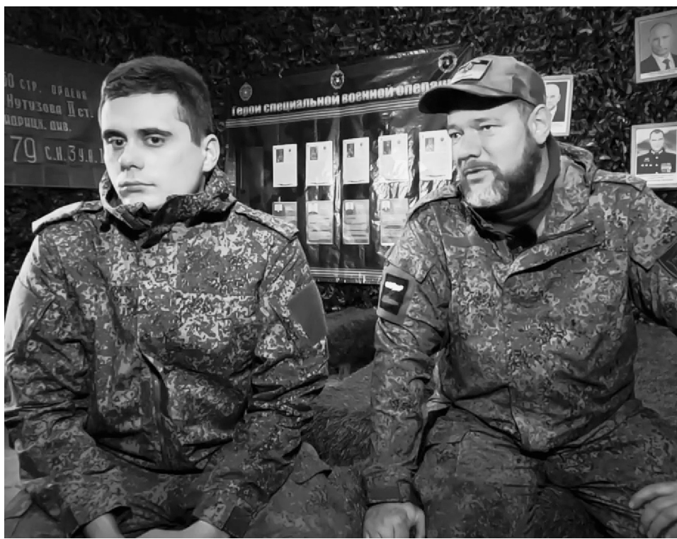
Завтра — новый день и новые задачи. И у отца, и у сына. И опять будет болеть отцовское сердце в ожидании сына с боевой задачи.

— Я контролирую сына, особенно, когда он собирается на боевые задачи. Замучил его уже этим РБЖ, — смеется отец.