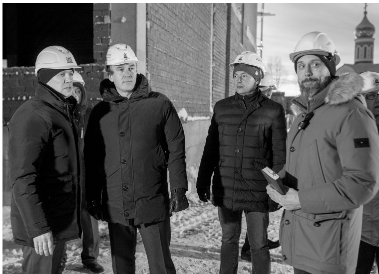
Следующий учебный год педагоги и студенты Югорского политехнического колледжа начнут в новом здании.

Напомним, в следующем году благоустроят спортивную площадку на территории школы для всех жителей города. Средства на эти цели уже предусмотрены в бюджете автономного округа.