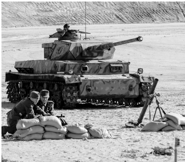
Для ретроспективы подвиги задействовали семь единиц бронетехники, включая легендарный танк Т-34.

Стоит отметить, что организаторы мероприятия особое внимание уделили вопросам обеспечения безопасности: территория места событий была огорожена, зрители располагались на удалении. Участники реконструкции заранее прошли специальное обучение за счет средств гран-