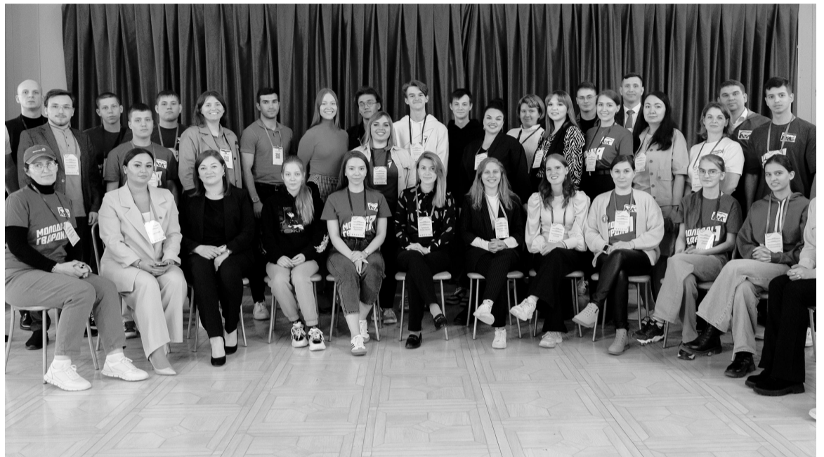
Идеи, выработанные участниками форума, войдут в нацпроект «Молодежь и дети», который начнет работать в 2025 году.

В Югорске прошел масштабный форум «Территория молодости». Представители молодежи из Югорска, Нягани, Ханты-Мансийска, Октябрьского, Кондинского и Советского районов, а также Сургута и Нефтеюганска говорили о добровольчестве, грантовой поддержке проектов, предпринимательстве и современных технологиях. В течение дня более 250 представителей западной части Югры совместно с экспертами различных сфер на трех площадках формировали предложения и проекты, которые в дальнейшем войдут в национальный проект «Молодежь и дети».