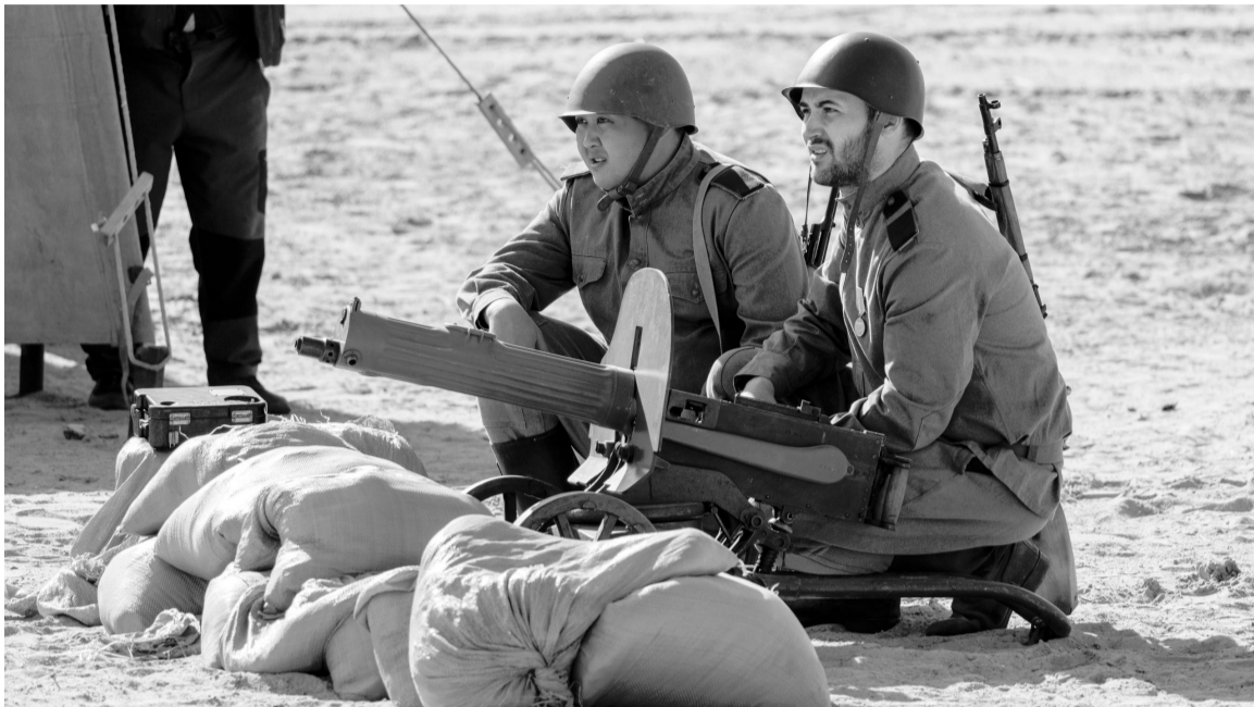
К участию в постановке привлекли около 100 реконструкторов, одев их в военную форму солдат Красной армии и вермахта.

«Подвиг во имя жизни» — так называлась масштабная военно-историческая реконструкция, которая впервые прошла в Югорске. Событие состоялось на лыжной базе предприятия «Газпром трансгаз Югорск».