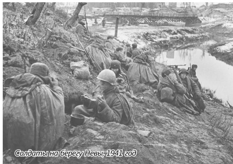
Солдаты на берегу Невы, 1941 год

По инициативе РУФСБ России по Тюменской области