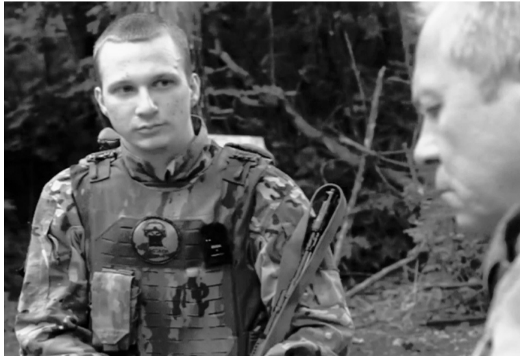
Парням очень нужна наша помощь — и прежде всего наше глубокое убеждение в том, что они герои и что победа будет за нами.

— Вообще я не служил. Но мне всегда было интересно сюда попасть, не мог решиться — мама... Но когда прошла мобилизация, когда много друзей стали подписывать контракт, подумал: а почему я сижу? Никому не сказал, кроме самых близких друзей. А когда уже подписал, приехал к маме и сказал: «Ты, конечно, будешь