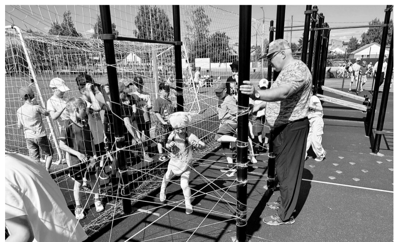
«Умная» спортивная площадка — центр притяжения для детей и взрослых.