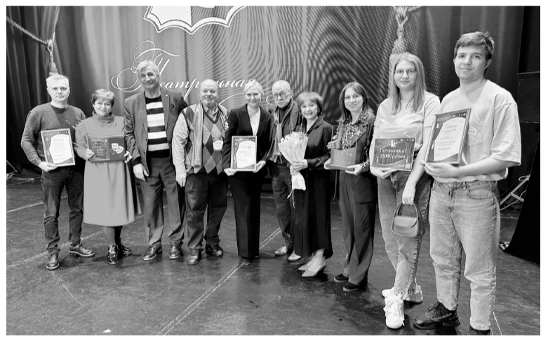
Югорск — ежегодная площадка для главного культурного события — окружного фестиваля «Театральная весна».