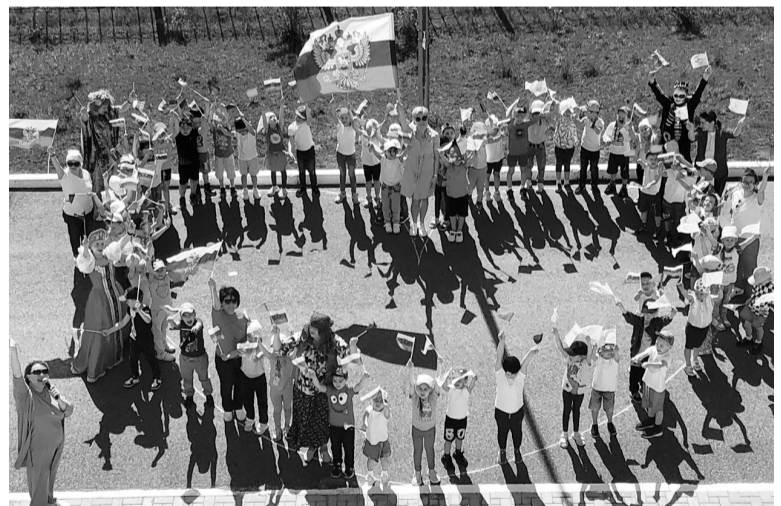
В Югорске отсутствует очередность в детские сады. Город занимает 1 место по показателю «Доля детей в возрасте 1-6 лет, состоящих на учете для определения в детские сады».