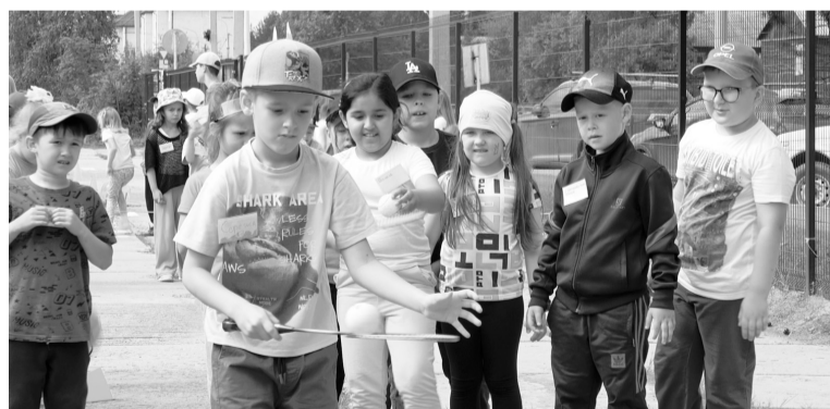
За третью смену в лагерях с дневным пребыванием весело и с пользой проведут время 506 детей.

«Это очень важно знакомить детей с основами физической подготовки. В то же время в дневных лагерях они учатся