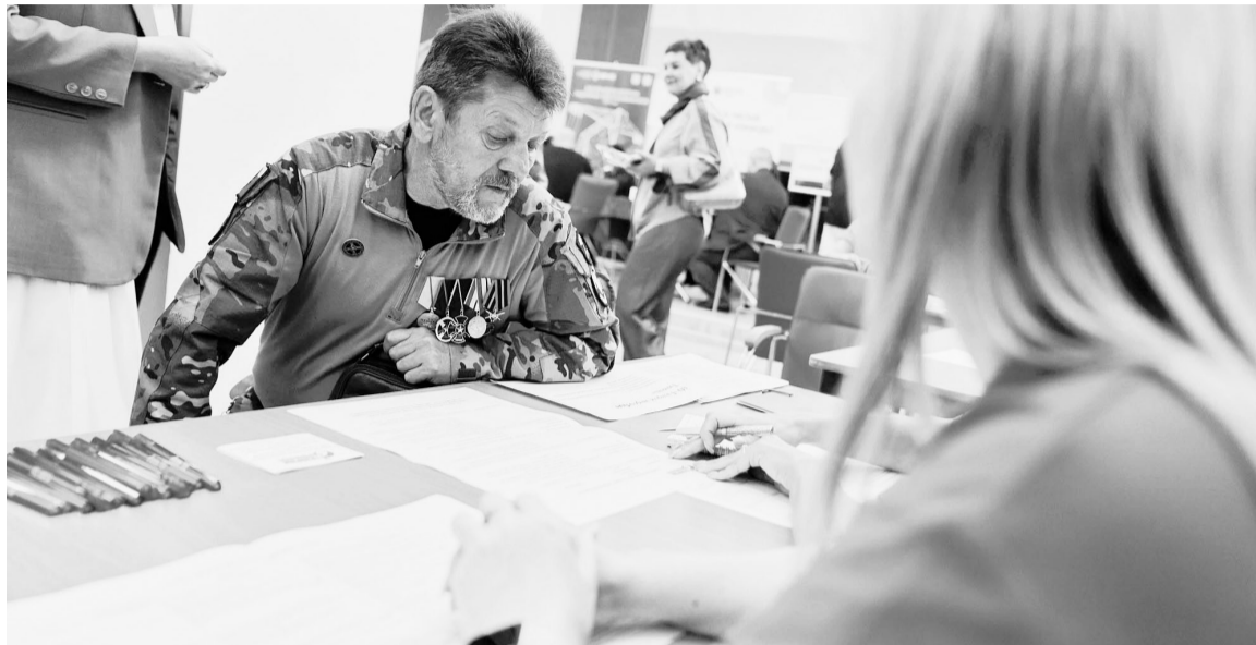
Ветераны СВО имеют право получить льготы на бесплатное переобучение, освоение новой специальности или повышение квалификации с дальнейшим трудоустройством.

«Мы заключили соглашение с Министерством образования и науки РФ о предоставлении возможности на любой из площадок нашей страны пройти обучение, переобучение. Уже есть заявки на обучение по техническим специальностям в Балтийский государственный университет и в Москву. Ребятам сопровождают на всех