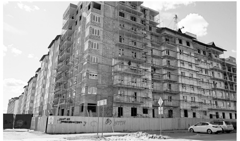
В 2024 году планируется ввести более 31 тысячи кв. метров жилья.

При этом важно не только подтянуть «слабые места» в экономике и социальной сфере, а также сохранить высокие темпы развития городского хозяйства. При таком подходе качественные изменения в жизни города будут происходить постоянно. Рейтинг рейтингом, а главное — это люди.