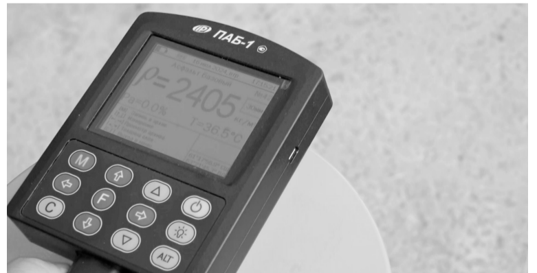
Современные приборы позволят на начальном этапе выявить недочеты при выполнении дорожных и других работ.

«Теперь у нас есть измеритель плотности бетона, который позволяет определить качество укладки асфальтобетонной смеси. Прибор показывает, соответствуют ли выполненные работы СНиПам, ГОСТам и условиям контракта. В случае отклонения от нормативов специалисты обязаны предъявить подрядчику претензию на переустройство. Не дожидаться, когда асфальт начнет сыпаться, а до начала эксплуатации дороги. При приемке работ мы проверяем и документы: паспорта, серти-