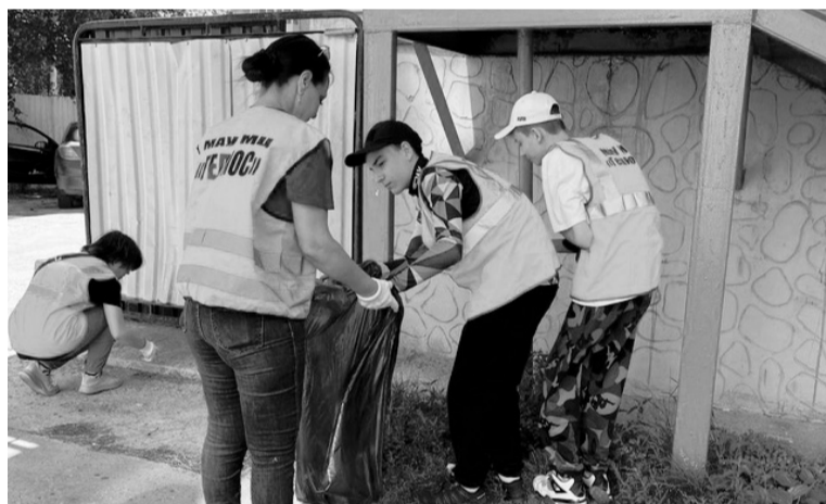
Благодаря ежедневному труду подростков из лагеря труда и отдыха наш город становится чище.

Самые активные участники получают специальные жетончики, которые называются «гелики». Эти «гелики» впоследствии можно обменять на сладости и другие интересные вещи. Пункт обмена расположен в молодежном центре. Итак, впереди еще целый месяц, чтобы весело провести время и заработать подарки. Адреса площадок: ул. Мичурина д. 13, 15, 17, 17-1;