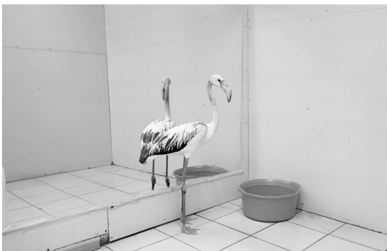
Фламинго отправился на постоянное место жительства в Екатеринбургский зоопарк.