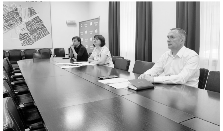
В Югорске негосударственные организации составляют 80 % поставщиков услуг.

Негосударственные организации составляют 80 % поставщиков услуг. Всего их в Югорске 74, среди которых два частных детских сада, православная гимназия. В прошлом году для поддержки их деятельности из городского бюджета направлено почти 58 млн рублей, финансовую помощь получили 23 негосударственных поставщика.