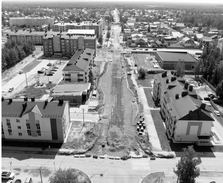
Строительство дороги на ул. Магистральной выполняется в три этапа, этот — завершающий.

«По согласованию с ДЖКиСК каждый житель может внести свои предложения по переустроенной схеме, которую согласовали с проектировщиком, тогда мы можем сделать подземные пути и к гаражам, и ко дворам. Это, конечно, ус-