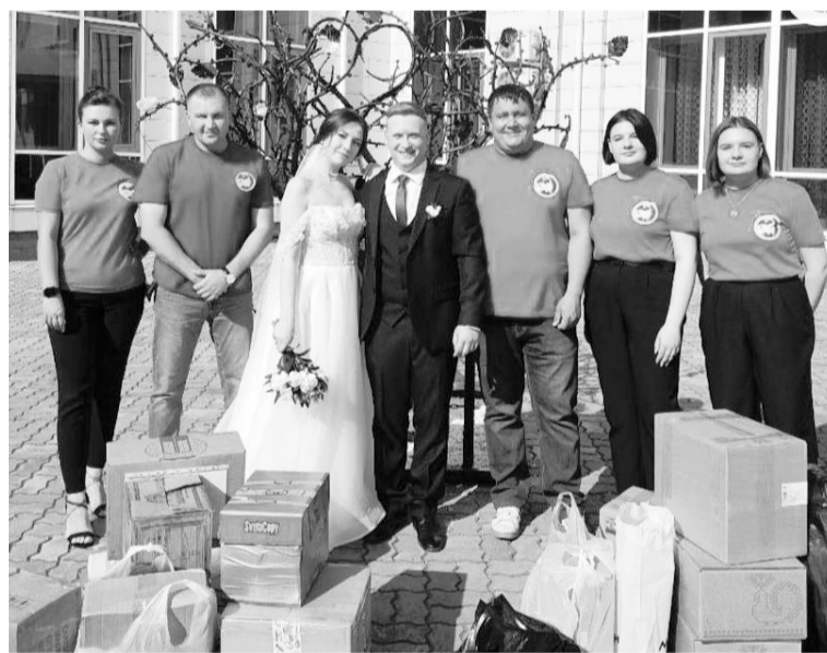
Поздравить молодую семью пришли соратники по гумкорпусу.

На свадьбу волонтеров Гуманитарного добровольческого корпуса Югры гости вместо подарков приносили помощь жителям Донбасса.