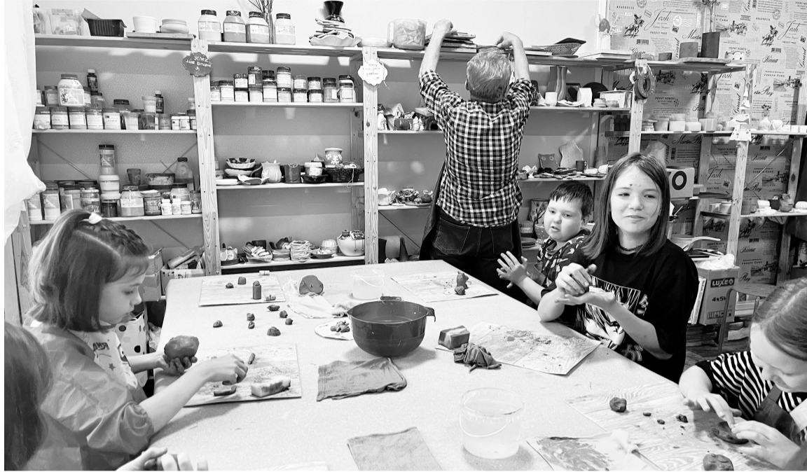
На мастер-классе по гончарному делу дети своими руками вылепили любимых героев мультфильмов.

Кроме того, в «Гелиосе» для тех, кто хочет заработать на карманные расходы, организованы молодежно-трудовые отряды (МТО). Члены отрядов следят за чистотой улиц, дворов, детских игровых площадок, территорий детских садов