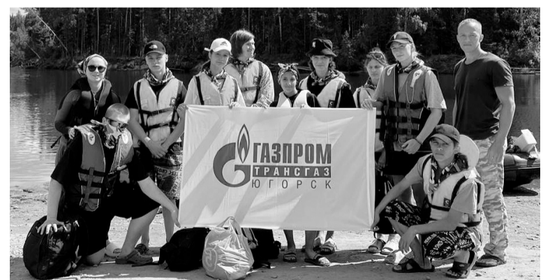
Двухдневный сплав по реке Лозье стал проверкой на выносливость и стрессоустойчивость.

В первый день преодолели 13 км. Вечером остановились