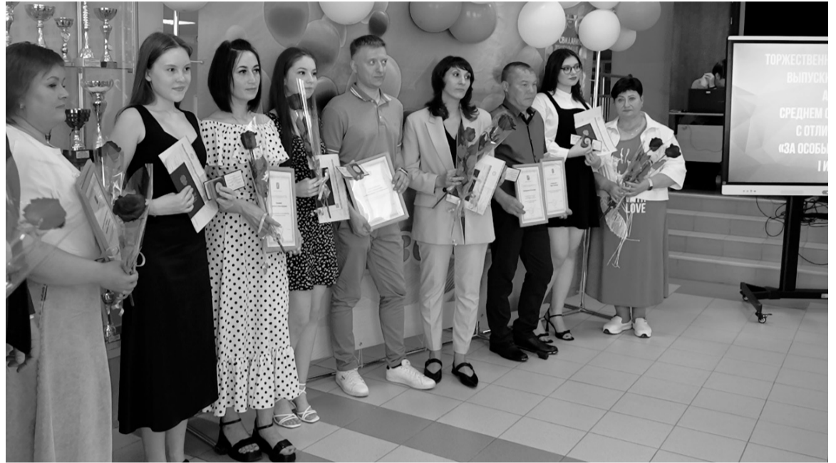
Лучших выпускников чествовали в торжественной обстановке.

В Югорске подвели итоги экзаменационной кампании. В этом году 207 одиннадцатиклассников сдавали ЕГЭ и 553 девятиклассника — ОГЭ. Выпускники успешно справились с испытанием и продемонстрировали достойный уровень знаний.