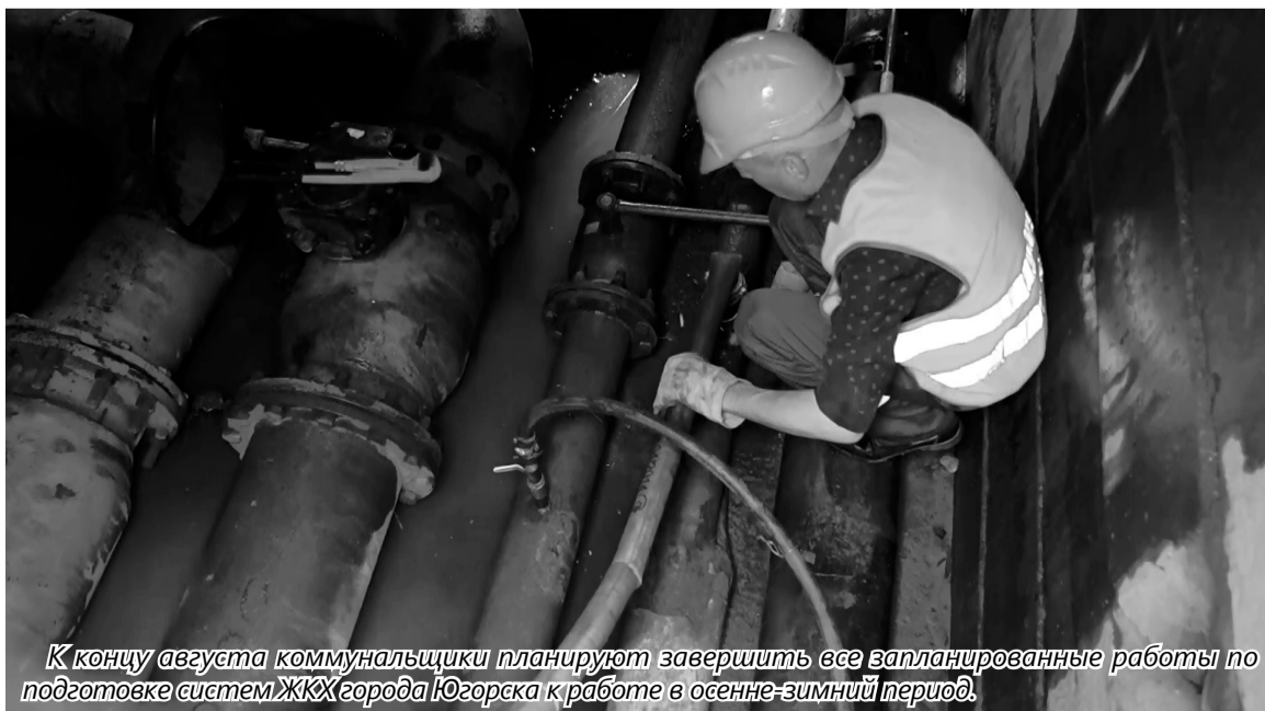
К концу августа коммунальщики планируют завершить все запланированные работы по подготовке систем ЖКХ города Югорска к работе в осенне-зимний период.

Ремонт котельного и водоочистного оборудования проводится ежегодно в рамках утвержденного плана мероприятий по подготовке коммунального хозяйства города Югорска к работе в осенне-зимний период. Всего МУП «Югорскэнергогаз» обслуживает 17 наземных и 4 крышных котельных. На котельных в летний период будет выполнен ремонт технологического оборудования. Это чистка и промывка 112 котлов, ревизия и ремонт теплообменников, насосного оборудования, электрики и автоматики. Вместе с тем будут произведены профилактические и ремонтные работы на водозаборных станциях, водоочистных сооружениях и артезианских скважинах. К началу отопительного сезона будут промыты все канализационные колодцы в городе.