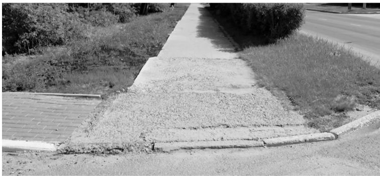
При ремонте тротуара вдоль пешеходного туристического маршрута устанавливают бордюры, убирают выбоины, обустраивают понижения для маломобильных групп населения.

«Эти работы направлены на то, чтобы привести тротуары в соответствие нормативам, обеспечить комфортное передвижение пешеходов, мам с колясками, а также маломобильных