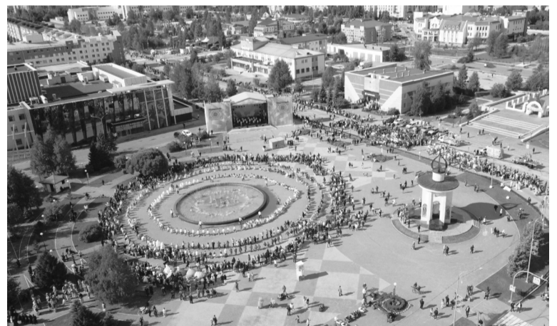
Югорск — современный развивающийся город, где сохраняются традиции и внедряются передовые технологии.

В 1991 году в опросе населения по выявлению мнения о присвоении поселку статуса города приняли 9339 участников, 68 % из которых проголосовали за присвоение поселку статуса города. 13 июля 1992 года Указом Верховного Совета Российской Федерации поселок Комсомольский был переименован в город Югорск и отнесен к категории городов районного подчинения. В декабре 1996 года Югорск получил статус города окружного значения, соответствующий закон приняло правительство нашего региона. Тогда же поселок Мансийский и поселение военного гарнизона (Комсо-