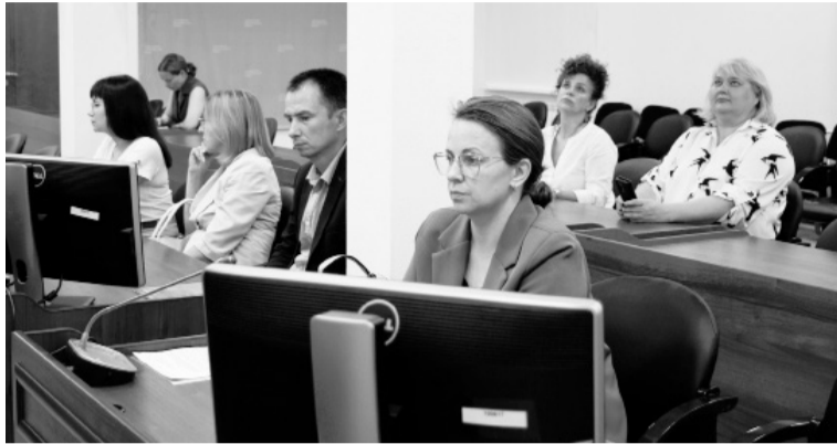
Члены корсчета по делам инвалидов наметили планы дальнейшей работы по созданию безбарьерной среды.

Проект благоустройства сквера участвует во Всероссийском конкурсе лучших проектов создания комфортной городской среды. Результаты будут подведены до 1 сентября 2024 года. В случае победы Югорск получит средства на проведение работ. Предварительная стоимость проекта составляет 270 млн рублей.