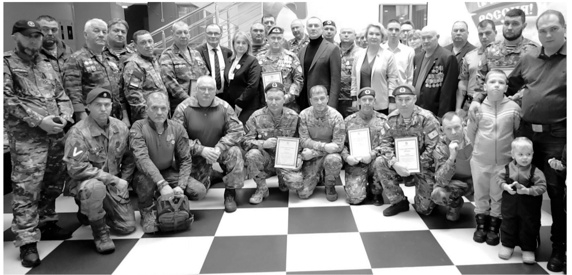
Ветераны СВО намерены поддерживать своих боевых товарищей, а также заниматься военно-патриотическим воспитанием молодежи.

Югорчане, вернувшиеся из зоны СВО, не только с честью выполнили свой воинский долг, но и продолжают вносить значимый вклад в развитие общества.