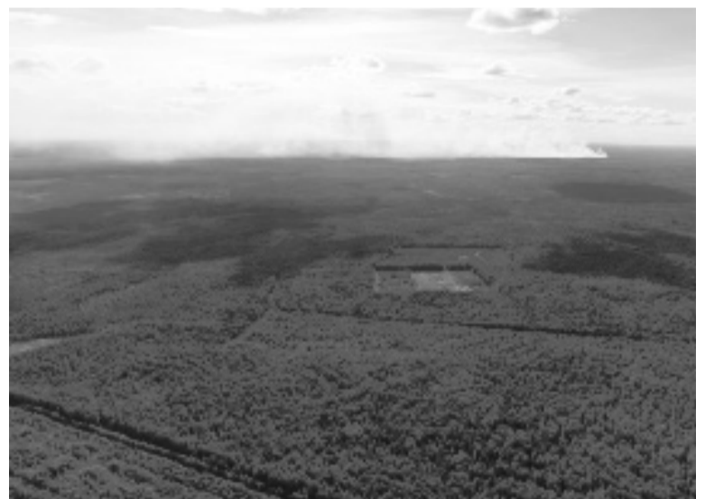
В черте Югорска лесных пожаров нет, но жители города могут ощущать запах гари от возгораний на территории Советского района.

«На территории Югорска и Советского района на протяжении нескольких недель стоит жаркая сухая погода, что в свою очередь приводит к повышению класса пожарной опасности в лесах. Основными причинами пожаров в лесах являются природные факторы, например, гроза, но не стоит забывать и про человеческий фактор. На сегодняшний день имеются зарегистрированные действующие природные пожары на площади порядка 200 гектаров, все они находятся на территории Советского района. Угрозы населенным пунктам нет, ближайший находится на расстоянии 30 км. При этом жители Югорска могут чувствовать запах гари и видеть небольшую дымку», — рассказал Евгений Зарембо, и.о. начальника 9 пожарно-