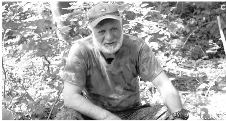
«Седой» благодарен Югре за постоянную помощь.

«Знаю, что такое детство и детская радость. Я здесь ради всех детей, чтобы у них было завтра, и оно было счастли-