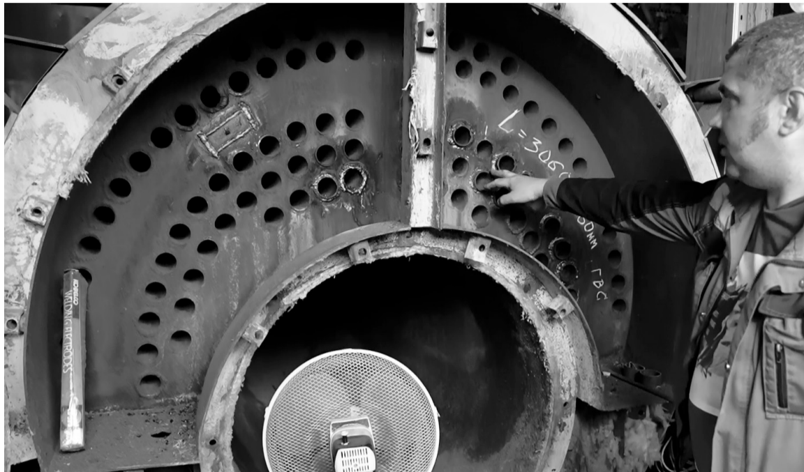
Ежегодное отключение горячего водоснабжения необходимо, чтобы выполнить ремонт оборудования и повысить качество оказываемых услуг.

Рекомендуемый срок ремонта, связанный с прекращением горячей водоснабжения — 14 дней. Именно на две недели планово по графику отключается подача горячей воды