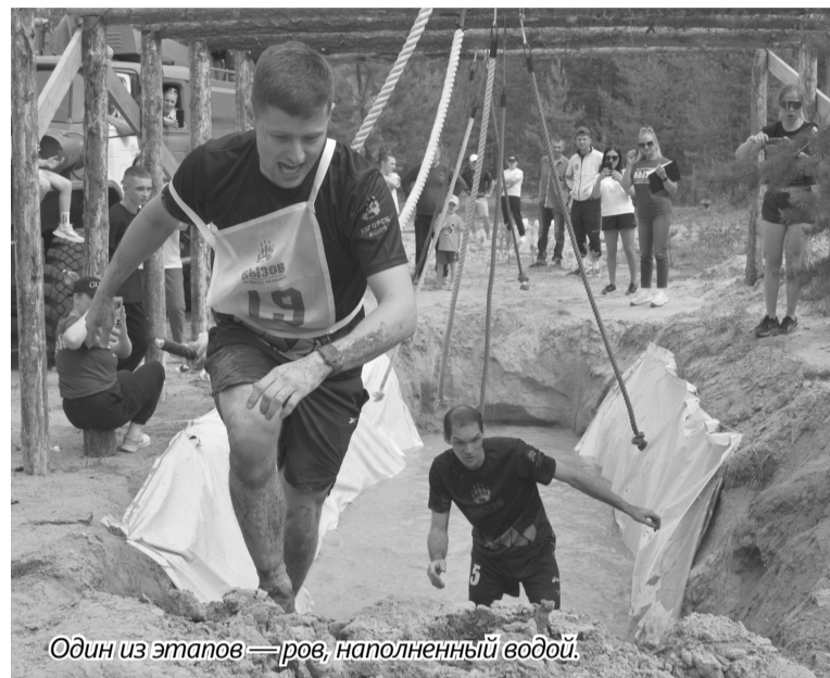
Один из этапов — ров, наполненный водой.