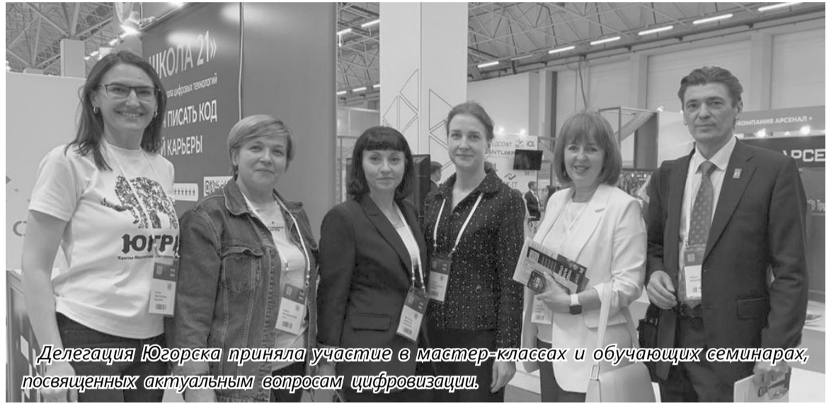
Делегация Югорска приняла участие в мастер-классах и обучающих семинарах, посвященных актуальным вопросам цифровизации.

В Ханты-Мансийске прошел XV Международный IT-форум с участием стран БРИКС и ШОС. Югорск принял участие в главном IT-мероприятии Югры.