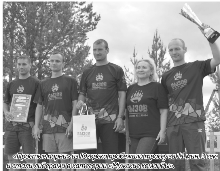
«Простые парни» из Югорска пробежали трассу за 111 мин. 3 сек. и стали лидерами в категории «Мужские команды».

экстремального забега «Вызов» в категории «Смешанная команда» стали команды «Мамонты» (Югорск), «Умные и спортивные» (Югорск), «Лига бега» (Междуреченский). Лучшими в категории «Мужская команда» также были признаны югорчане «Простые парни».