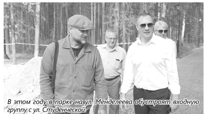
В этом году в парке на ул. Менделеева обустраивают входную группу с ул. Студенческой.