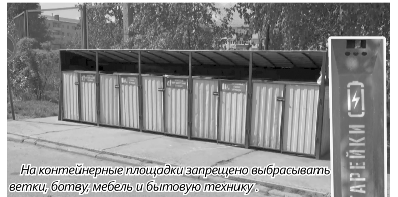
На контейнерные площадки запрещено выбрасывать ветки, ботву, мебель и бытовую технику.

Мебель, бытовая техника, коляски, велосипеды и все, что по своим размерам не входит в контейнер, относится к крупногабаритным отходам. Для их сбора в городе установлены бункеры-накопители. Вывозить туда ненужные вещи жители должны самостоятельно. Бункеры-накопители для крупногабаритного мусора обустроены на контейнерных площадках в районе ул. Газовиков и ул. Промышленной,