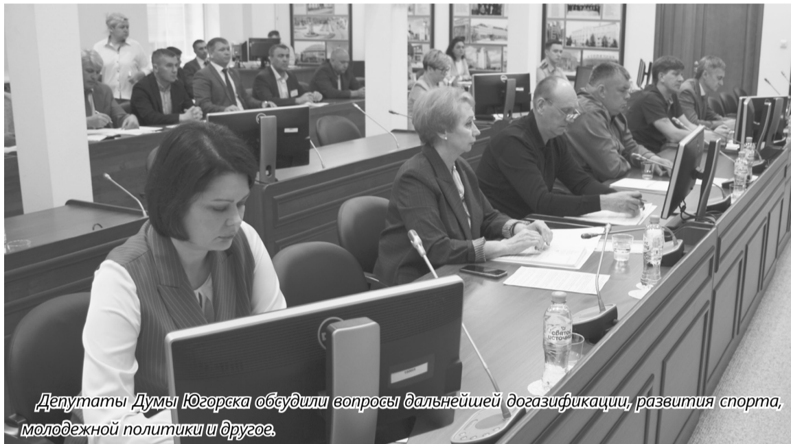
Депутаты Думы Югорска обсудили вопросы дальнейшей догазификации, развития спорта, молодежной политики и другое.

Этим летом запланировано выполнить капитальный ремонт сетей теплоснабжения общей протяженностью 640 м. Эти работы проведут на ул. Магистральной, ул. Буряка, ул. Геологов, на участке сетей от котельной № 17. Кроме того, в рамках подготовки к зиме выполнят гидравлические испытания сетей, ремонт технологического оборудования с заменой запорной арматуры.