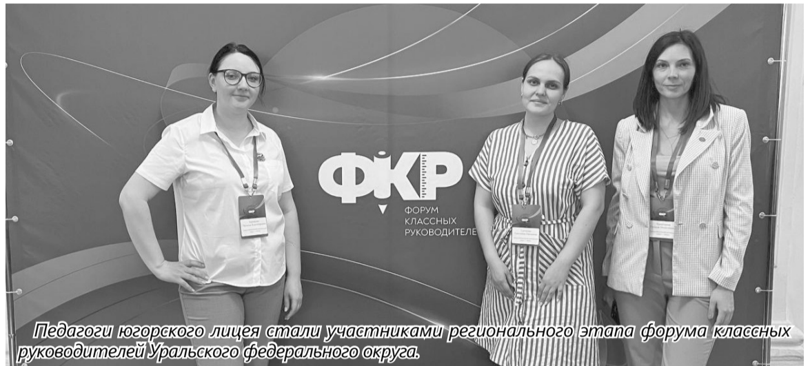
Педагоги югорского лицея стали участниками регионального этапа форума классных руководителей Уральского федерального округа.

Педагоги из Югорска приняли участие в форуме классных руководителей.