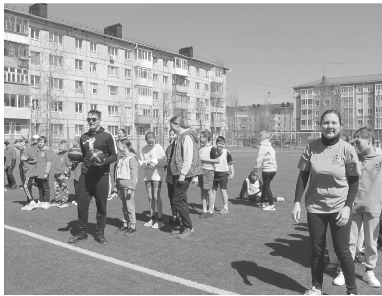
«Семейный комический забег» прошел на стадионе гимназии.

Как видим, программа летнего отдыха очень насыщенная и разнообразная, учтены все возрастные категории. Хотелось бы, чтобы все югорские дети зарядились энергией перед началом нового учебного года, набрались ярких впечатлений и обрели новых друзей.