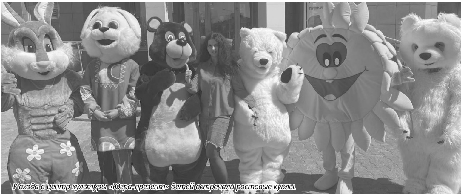
У входа в центр культуры «Югра-презент» детей встречали ростовые куклы.

На сцене «Югра-презент» в этот день для детей выступили цирковые артисты и творческие коллективы. Все номера были красочными, зажигательными и очень понравились зрителям.