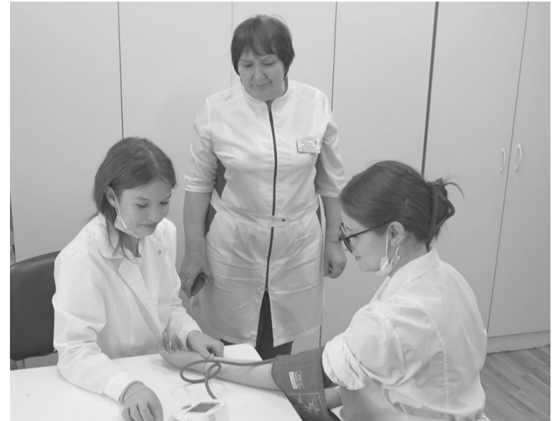
Ученики профильного медицинского класса школы № 2 под руководством наставников изучают азы будущей профессии.

«Я свой выбор сделала еще в 7 классе, когда начала изучать биологию. Мне очень нравится