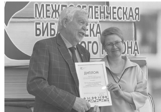
Литературно-творческое объединение «Элегия» награждено дипломом победителя II степени окружного конкурса литературных объединений Югры.

В экспертный совет конкурса вошли представители Российского книжного союза, окружной организации Союза писателей России, Государственной библиотеки Югры и органов власти автономного