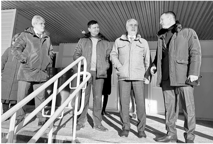
Капитальный ремонт школы № 2 находится на личном контроле главы Югорска.