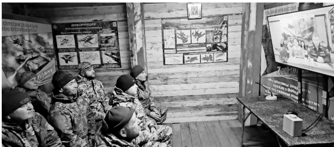
Военком и омбудсмен заверили бойцов, что власти Югры активно помогают их семьям, пока военнослужащие находятся в зоне СВО.

Военком и омбудсмен заверили бойцов, что власти Югры активно помогают их