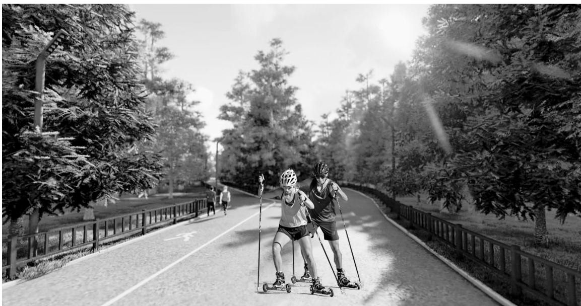
В «Долине ручьев» создадут новую инфраструктуру и профессиональные спортивные трассы.