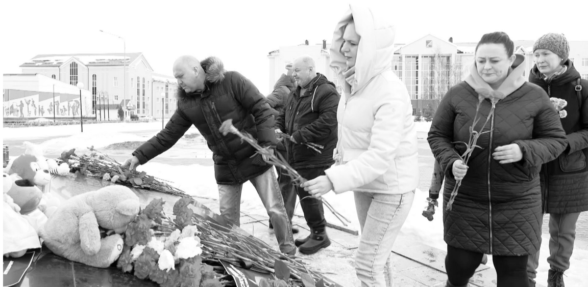
Несмотря на боль и скорбь, которые переполняют наши сердца, никто не сможет поколебать нашу сплоченность и волю, силу народа России.

Точно так же поступил один из охранников. Хорошо зная все ходы и выходы, мужчина вывел людей в безопасное место. Еще один герой, воспользовавшись моментом, когда террорист перезаряжал оружие, выбил автомат из его рук. «Молодой человек, присутствовавший во время событий в «Крокус Сити Холл», атаковал одного из террористов, отобрал у него автомат и ударил его прикладом, ему удалось спасти десятки человек», — сообщили очевидцы. Глава СК уже поручил представить мужчине к награде. И таких историй — много. Обычные неприметные люди, возможно,