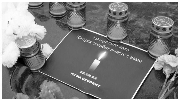
Цветы и зажженные свечи — в память о погибших в Подмосковье.

Таксисты и простые жители бесплатно увозили от места трагедии тех, кто сумел спастись. «В первую очередь я человек, а потом таксист», — коротко сказал еще один безымянный герой. На автозаводах «Газпромнефти» бесплатно заправляли топливом и кормили бригады экстренных служб, занятых ликвидацией последствий теракта. Наутро после трагедии возле центров приема донорской крови выстроились очереди из желающих помочь пострадавшим от теракта. Все это — яркий пример того, что наш народ не запугать и не сломить. В критических ситуациях мы становимся еще сильнее, еще сплоченнее.