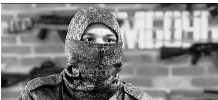
«Гусь» был готов к тому, что когда-то придется защищать Родину.

По его словам, уходил на фронт абсолютным атеистом. Но, как выяснилось, поговорка про то, что на войне атеистов не бывает, совершенно справедлива.