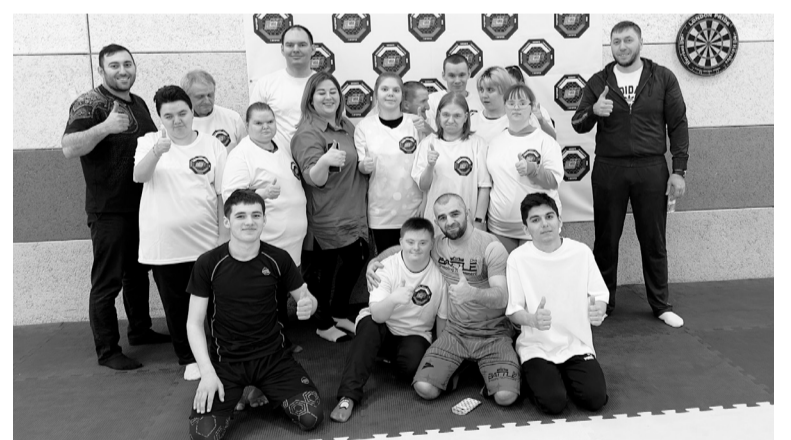
Мастер-класс по джиу-джитсу принес пользу и новые впечатления всем его участникам.

В завершение мероприятия было организовано чаепитие, а каждый участник получил памятный подарок от президента Федерации СБЕ ММА Югорска