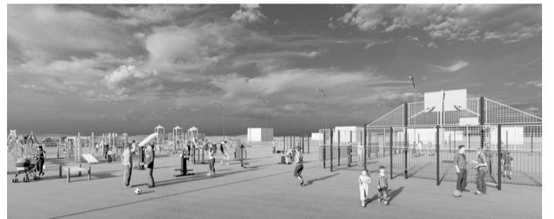
Пустырь может стать местом спокойного и активного отдыха.

Кроме размещения на ней качелей, каруселей, спортивного корта, баскетбольной площадки, тренажеров, лавочек для отдыха и игровых зон для малышей, предполагается провести озеленение этой территории. Если наш проект не победит в общегородском голосовании, мы продолжим благоустройство своими силами. Будем участвовать в инициативных проектах, подавать заявки на гранты различного уровня» — поделился планами депутат.