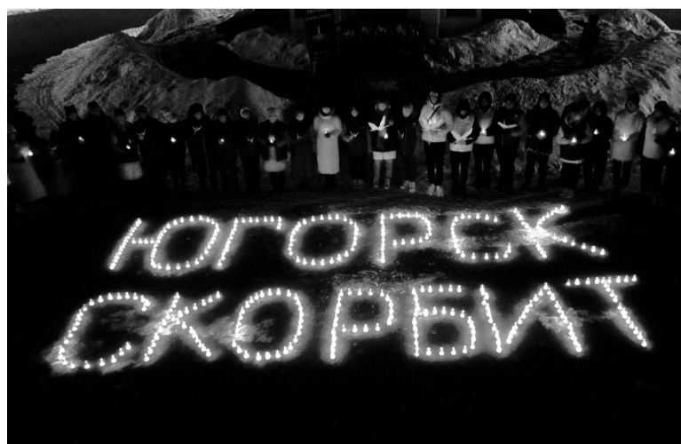
Югорчане приняли участие в акции «Свеча памяти».