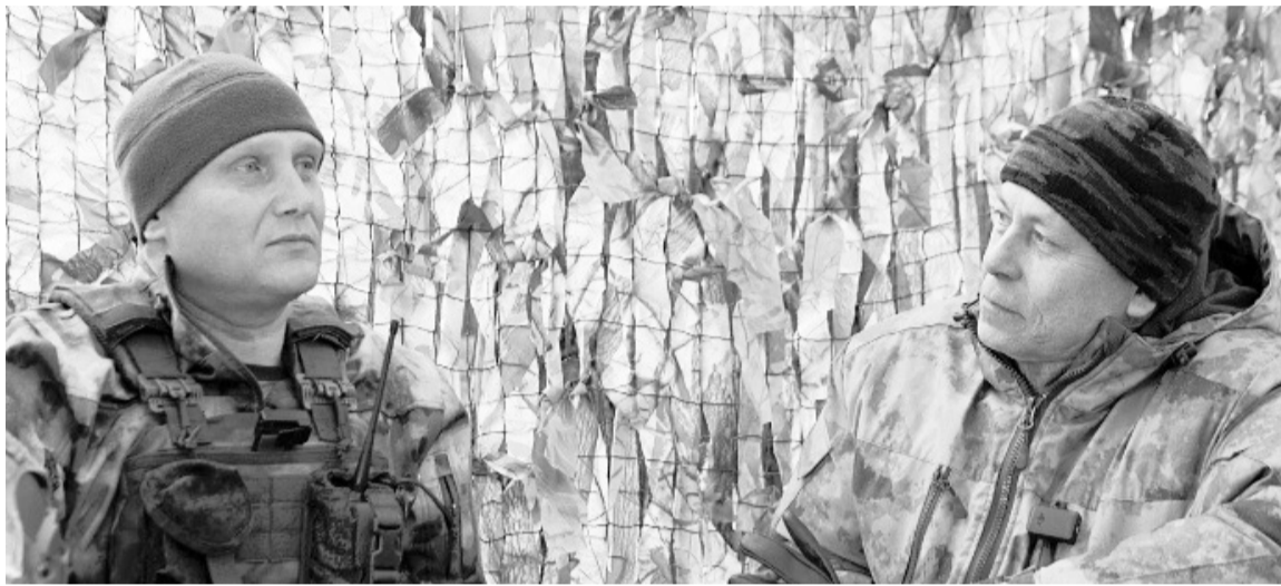
«Эти два слова — «Я русский» — вызывают удивительное ощущение сопричастности к нашей огромной стране, это непередаваемое состояние».

«Мы многое забыли, мы просто спали, как тот медведь в берлоге, а в это время рождался и поднимал голову новый нацизм. Но мы проснулись и