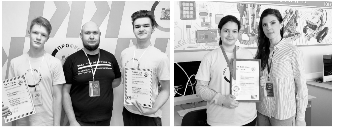
Залог победы — хорошая подготовка и умение работать в команде.

Подведены итоги регионального этапа Чемпионата по профессиональному мастерству «Профессионалы» среди юниоров в Сургуте и среди юниоров в компетенции «Графический дизайн» в Советском. Всего в программе соревнований было 52 компетенции, включая 12 юниорских.