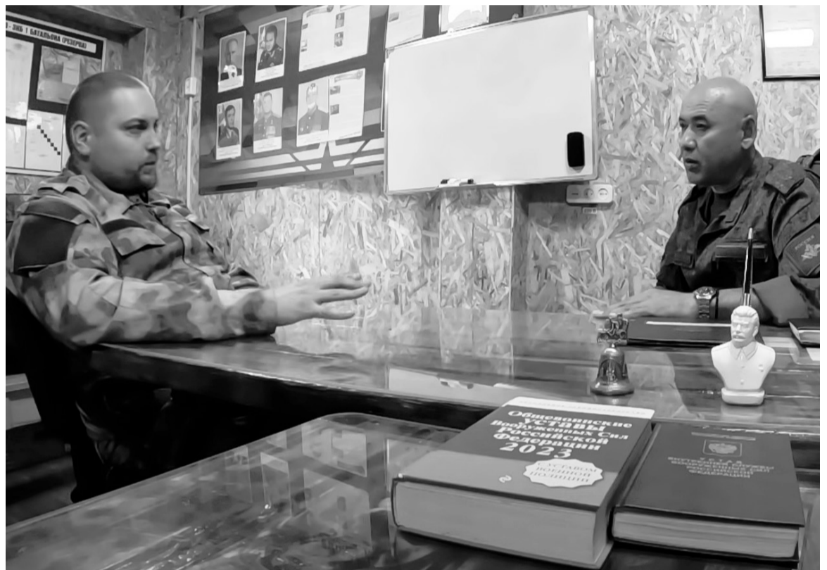
У нас все получится, он в этом уверен, ведь Россия несет в мир добро.

«В 2013 году у нас был юбилей выпуска. Встретили нас, россиян, холодно. Впрочем, даже когда мы выпускались, уже тогда проявлялись искорки этого национализма, и казалось, что закончится все чем-то очень нехорошим. Не любили там наших, называли москалями. В 1991 году 7 ноября мы, курсанты, стояли в колонне перед воинским парадом на Крещатике. Напротив была гостиница, из окон которой молодчики махали бандеровскими флагами и оралы «Геть москалей!». До сих пор жалею, что магазины автоматов тог-