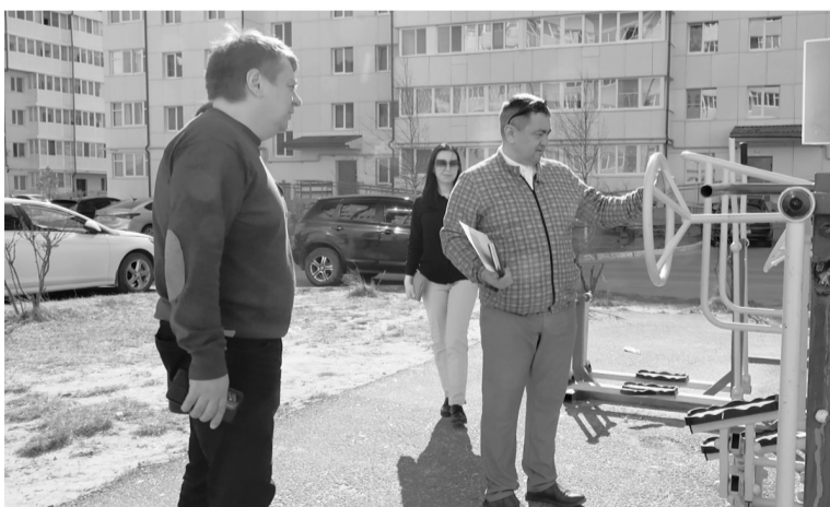
Члены комиссии проверяют все детские игровые и спортивные площадки.

«Перед началом летних каникул у нас запланирована проверка всех детских городков. Помимо муниципальных, в городе порядка ста площадок, которые находятся во дворах многоквартирных домов. За них отвечают управляющие компании. В слу-