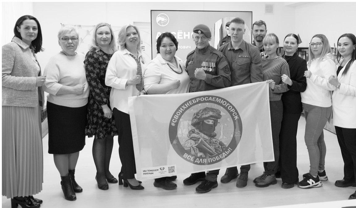
Бойцы, выполняющие задачи в зоне СВО, благодарят волонтеров за поддержку.

В этот же день «Батя» встретился с трудовыми коллективами, сотрудниками администрации Югорска и руководителями учреждений