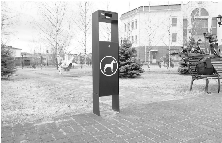
В городе установлено 13 дог боксов, в следующем году планируют добавить еще 4.

Еще одна хорошая новость для владельцев домашних животных. Если вы хотели стерилизовать своего питомца,