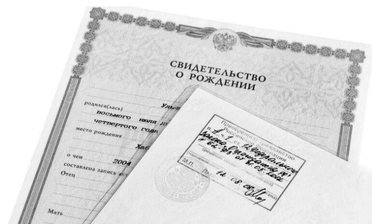
Штамп о гражданстве ставится на обратной стороне свидетельства о рождении.

Также изменен порядок пропуска через государственную границу несовершеннолетних.