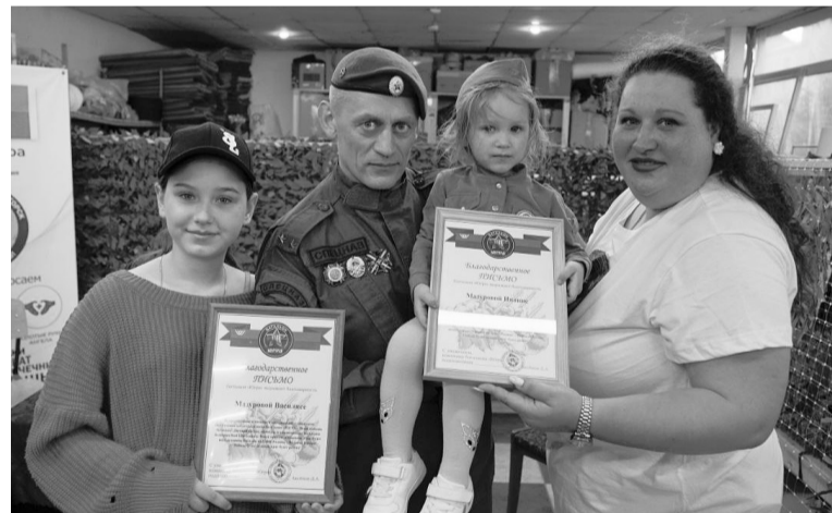
Семьи участников СВО — активисты волонтерского движения.

На встрече в неформальной обстановке волонтеры и