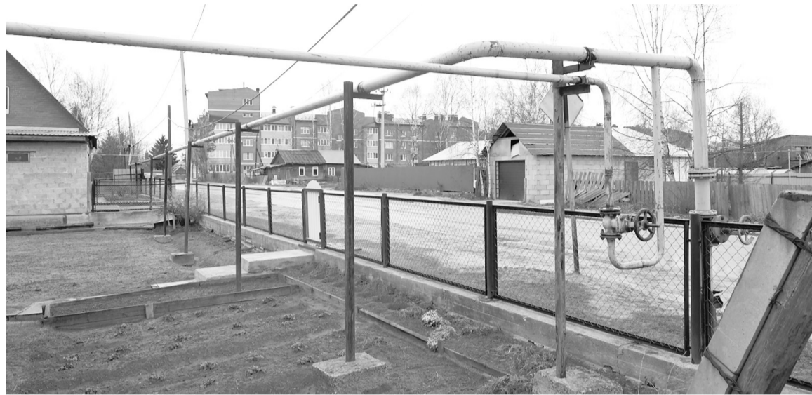
Подведение газопровода до земельного участка и подключение к сетям — бесплатно, работы внутри земельного участка ведутся за счет средств собственника.