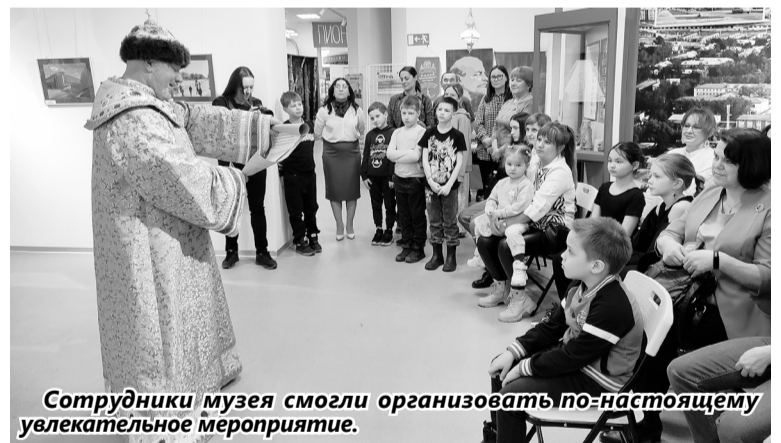
Сотрудники музея смогли организовать по-настоящему увлекательное мероприятие.

Интерес у детей вызвала экспозиция, посвященная быту советской семьи. Они с удивлением рассматривали фильмоскоп для диафильмов, радиолу, черно-белый телевизор, стаци-