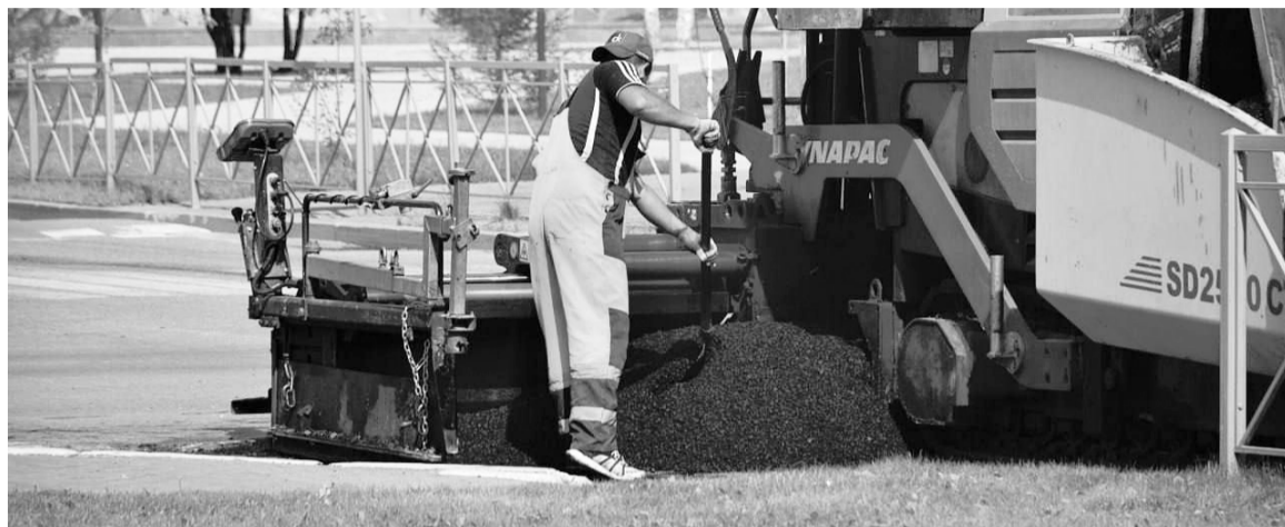
Подсыпка ям гранулятом — это временная мера до начала ремонта дорог.

Традиционно ремонт дорожного полотна и пешеходных тротуаров в Югорске начинается в мае, но начало работ зависит от погодных условий.