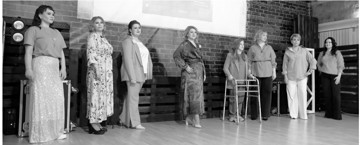
Проект помогает участницам преобразиться.

Югорчанки из семей участников СВО стали участницами проекта «Жить жизнь».