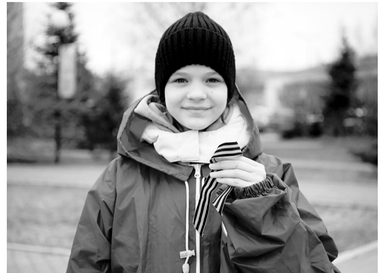
Георгиевская ленточка — это память о великом подвиге наших предков.

День Победы — праздник, который в нашей стране является действительно всенародным. Сохранить память о великом подвиге предков и передать ее подрастающему поколению призваны различные акции и мероприятия, которые проводятся накануне.