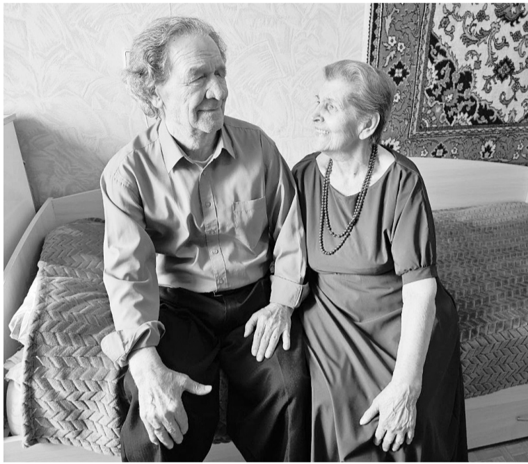
Умение решать все вопросы сообща — залог крепкой семьи.