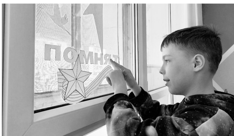
Югорчане поддержали акцию «Окна Победы».

В образовательных учреждениях города прошли и другие памятные мероприятия. Все школы и детские сады Югорска поддержали всероссийскую акцию «Окна Победы». Дети рисова-