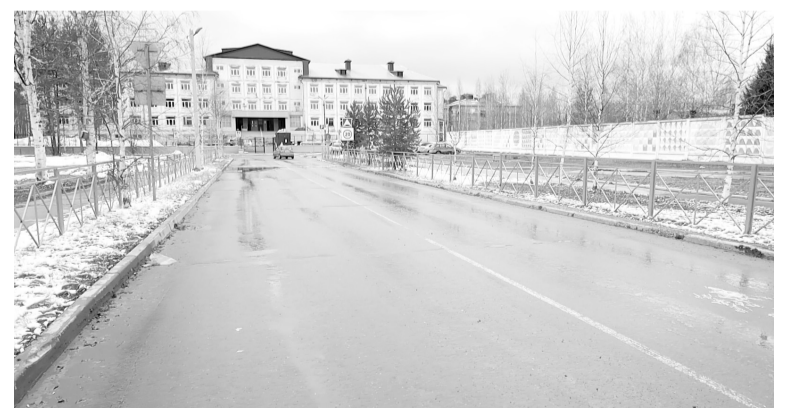
В этом году будет благоустроена территория школы № 2.

После сноса старых деревянных домов на ул. Мира остались пустыри. Уже сформирован план по комплексному развитию этой территории. По словам главы муниципалитета, в скором времени будет вывезен мусор, оставшийся от сноса дома на ул. Мира, 73А. Контракт на эти работы уже заключен. На днях в результа-