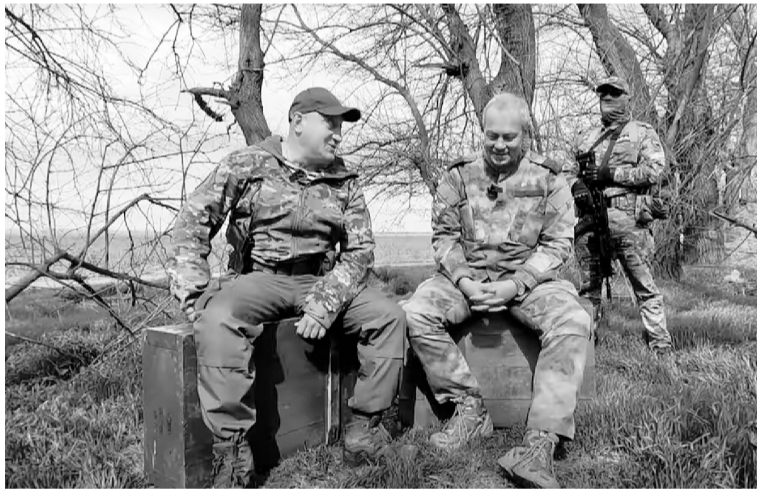
Основные принципы успешной службы базируются на банальном — на дисциплине.

«Главное — слушаться отцов-командиров, как это ни банально звучит. Потом — схватывать все на лету, так как времени на