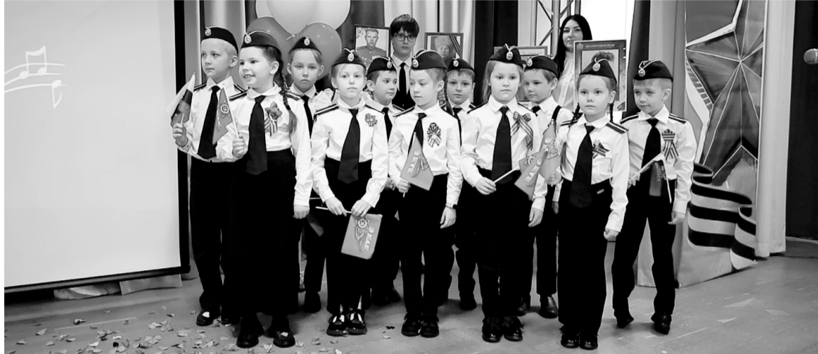
Все участники смогли преодолеть волнение и отлично выступить.

В лицее им. Г.Ф. Атякшева прошел марафон военно-патриотической и солдатской песни «Песни великого подвига».