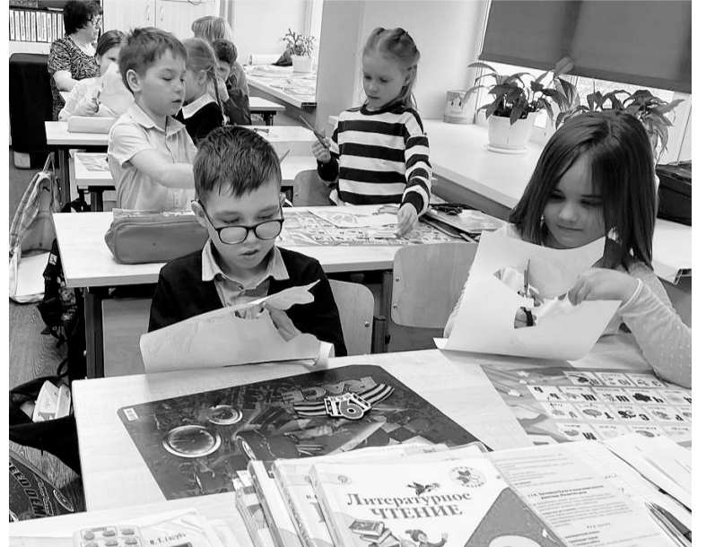
Сотрудники музея истории и этнографии провели мастер-классы по изготовлению значков к 9 Мая.

Есть такие события, которые не стираются из памяти народа, а с каждым годом приобретают особенную значимость, становятся бессмертными. К ним относится Победа нашего народа в Великой Отечественной войне.