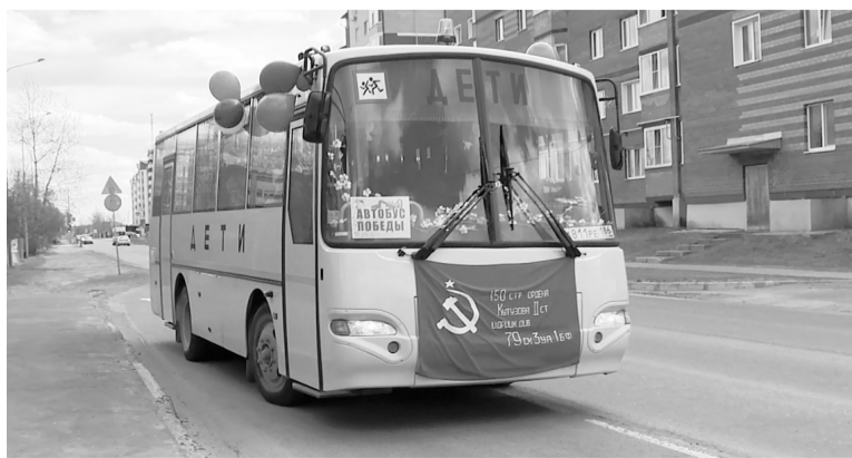
9 Мая по улицам Югорска курсирует «Автобус Победы».

«Из училища нас прибыло десять человек: техники, стрелки-радисты. Я был мотористом по обслуживанию легендарного одномоторного самолета-штурмовика Ил-2. Немцы боялись этой машины за огневую мощь и живучесть», — вспоминает ветеран.