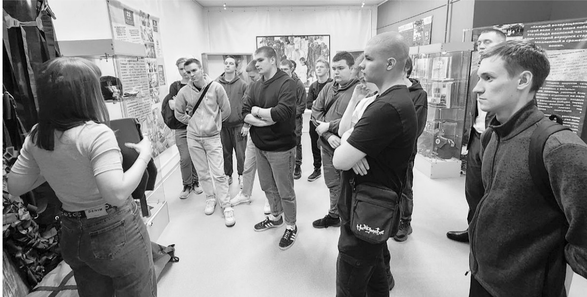
Старшеклассникам продемонстрировали предметы первой необходимости, которые изготавливают участники сообщества «СвоихНеБросаем».

В Музее истории и этнографии продолжают тематические экскурсии по временной выставке «Солдаты в белых халатах». Выставка интересна для взрослых и ребят разных возрастов — от воспитанников детских садов до студентов колледжа.