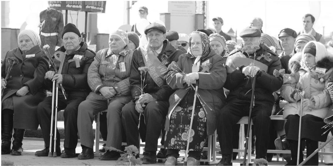
С каждым годом все меньше остается в живых участников войны и тех, кто трудился в тылу, приближая Победу.